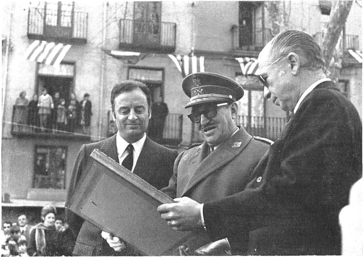
El Presidente de la Diputación, en presencia del Gobernador Civil, hace entrega del Diploma de Concesión de la Medalla de Oro de la Provincia