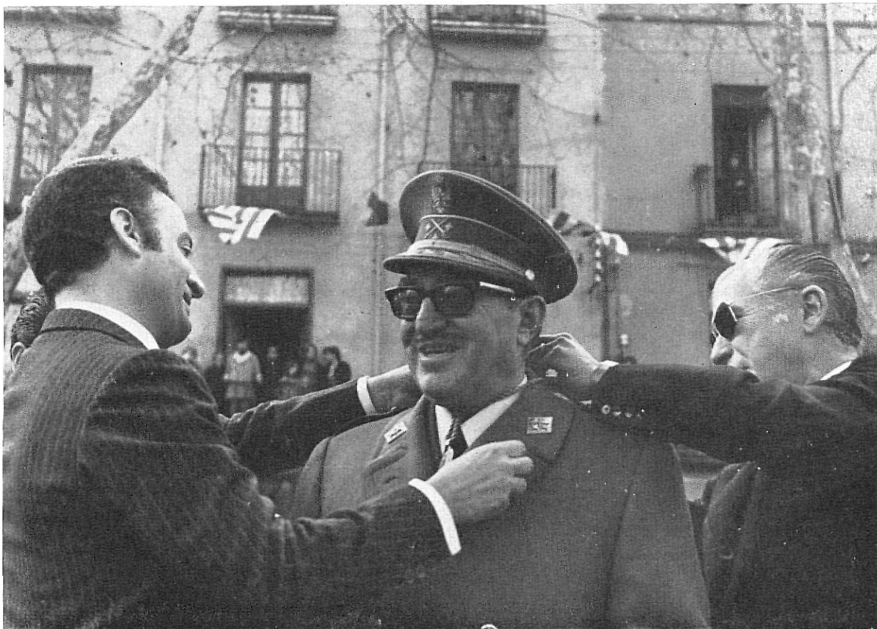
El Gobernador Civil y el Presidente de la Diputación, entregan la Medalla de Oro de la provincia al Capitán General de Cataluña, don Alfonso Pérez-Viñeta