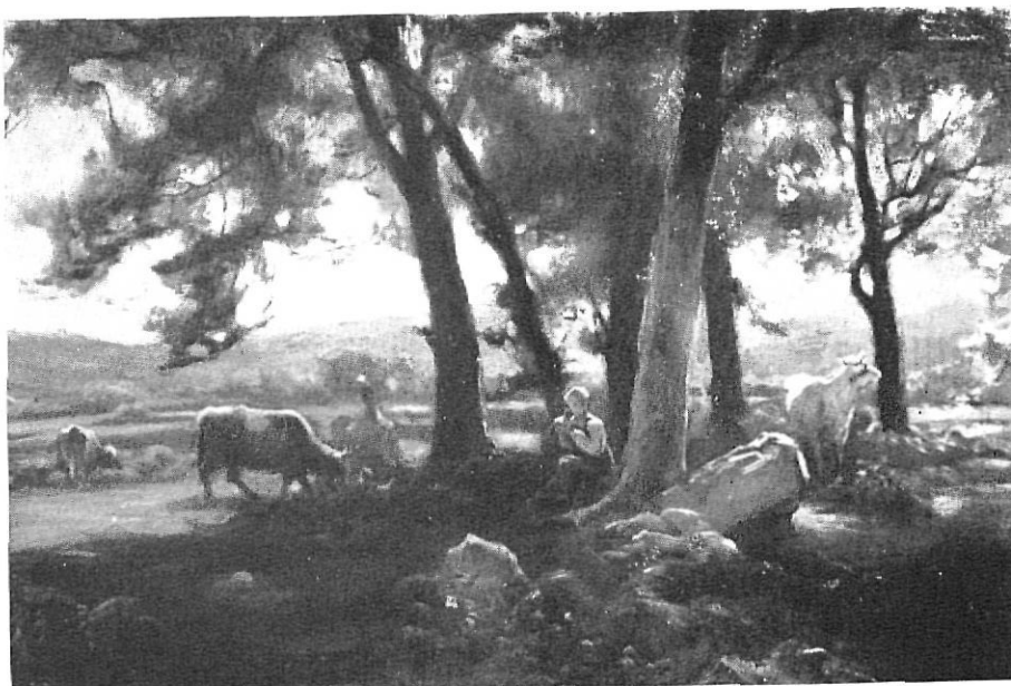
MELCHOR DOMENGE Paisaje, óleo

Bello inicio el de la presencia de Xargay y Fulcará en Olot, inicio que ha de ser esto precisamente: un comienzo para una continuidad, que todos deseamos y en pro de la que laboraremos. Olot y Gerona han de unirse más y más mediante el vínculo del Arte, tan idóneo a ambas ciudades.