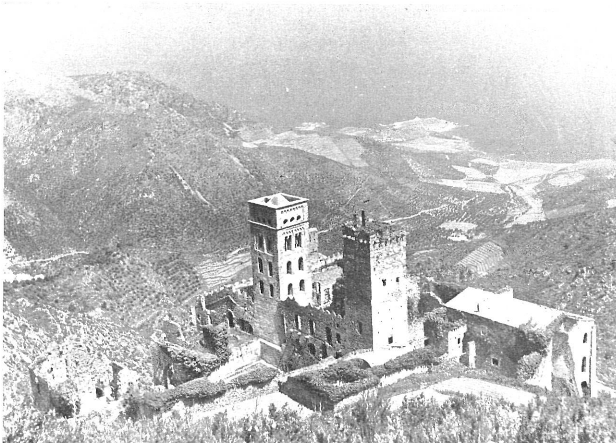
Lo monumental en la provincia le infunde también una personalidad, cuidando la Diputación de su restauración. El monasterio de San Pedro de Roda, tan arraigado a su historia