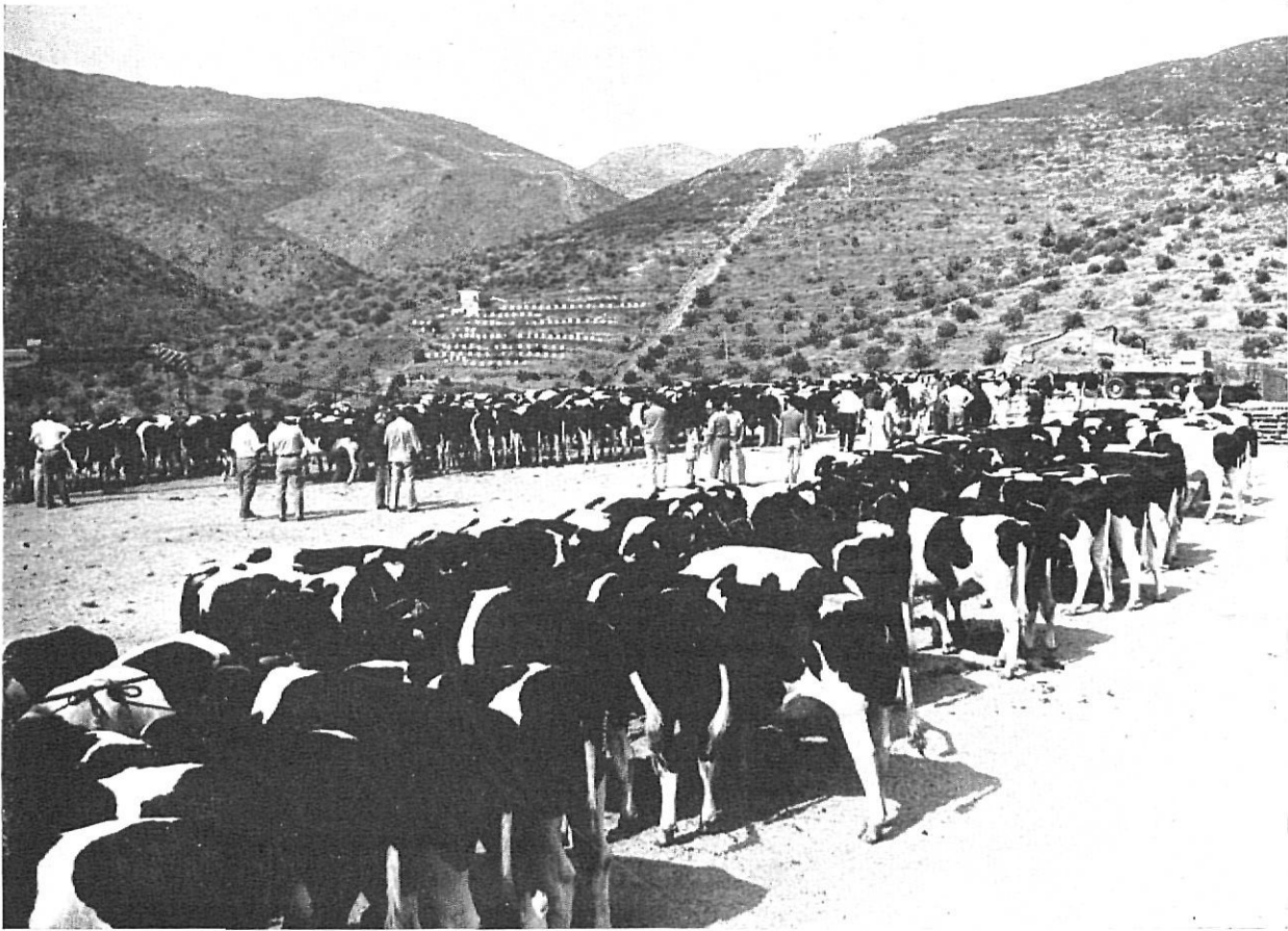
La ganadería con su selección para un mejor rendimiento, ha recibido atención durante el presente año