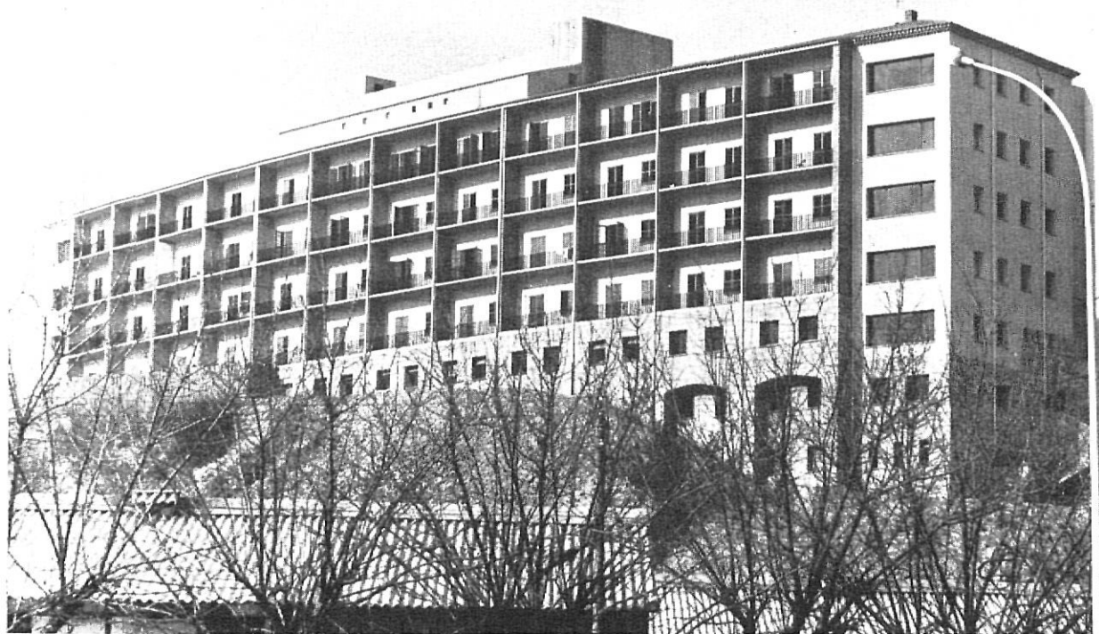
La parte exterior, del Hospital Geriátrico, constituye un magnífico mirador sobre Gerona, de este edificio modelo en su clase

A cada uno de los asistentes les fue entregada una carpeta en la que figuraban las realizaciones de la Corporación Provincial a lo largo del año que está terminando, lo que presuponia que cada uno de ellos pudiera seguir más de cerca las exposiciones que se hacían de palabra, a la vez que podía servir para concretar las preguntas necesarias.