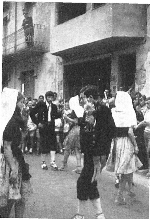
El «Ball del Ciri»

Bé, hem trobat bon lloc. Vora nostra, un avi. No podíem demanar res millor. Apreciem que els seus ulls guspíregen d'entusiasme mentre es mira els balladors que es preparen. Les mans a les butxaques, el cigar gruixut, mal fet, mig apagat, s'aguanta moll a un racó dels llavis sarmientosos. El flaviol llença al vent les notes estridents, preceptives de la dansa. Aleshores, els minyons d'avui, lluint les gales d'un ahir endin-sat a la llunyania, comencen a trenar els passos del ball cerimoniós i antiquíssim.