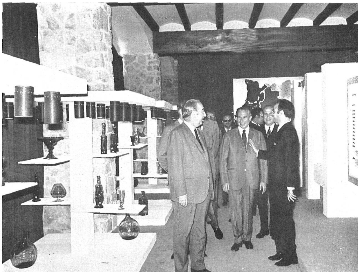
El Ministro de la Gobernación, recorre la exposición instalada en el interior de la Masía, acompañado del Gobernador Civil de Gerona, presidentes de las Diputaciones de Gerona y Barcelona (que se ven en la fotografía) y otras personalidades.