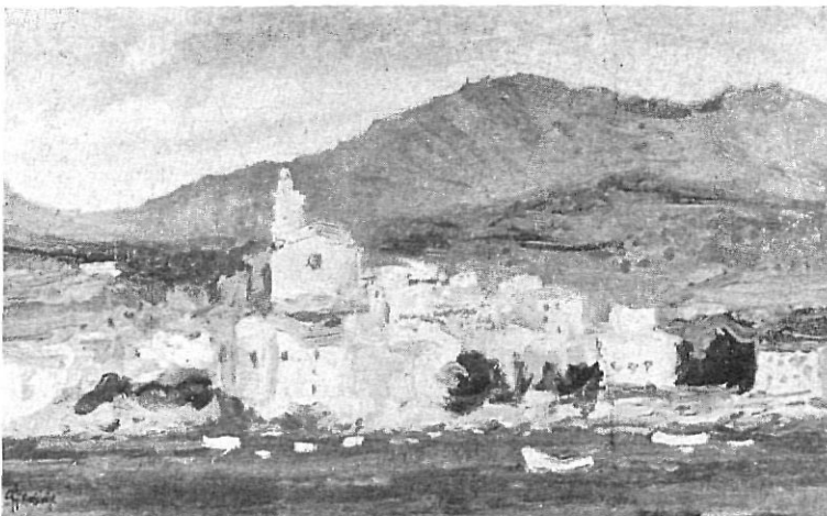
MONSALVATGE. — Cadaqués

El paisaje lo presenta normalmente el autor, constituído por apretada arquitectura urbana, rigurosamente construida. Grandes teoría de tejados en altibajo, cuales las vistas clásicas de Cadaqués, de Toledo y de París. Son estas realizaciones todas figurativas con tendencia que nos recuerda los tiempos y maneras del cubismo.