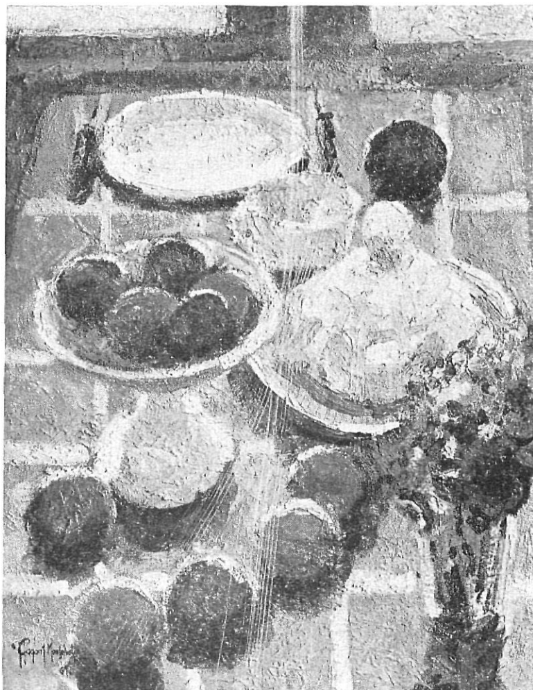
MONSALVATGE. — Bodegón

Nota descollante en la obra actual de Vayreda Canadell, es la armonía del color, que con espléndida riqueza y abundamiento tonal invade toda la tela y resalta a la misma, a pesar de la gran transparencia que preside todo el lienzo.