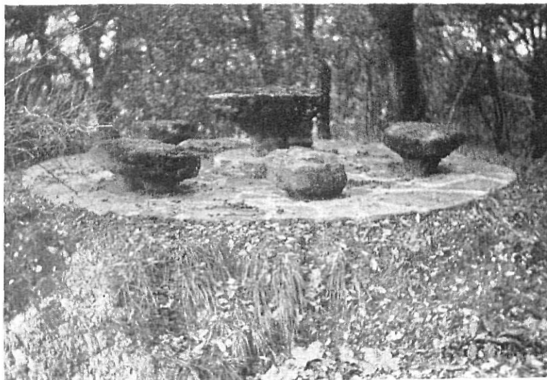
La taula i els seients dels quatre Barons