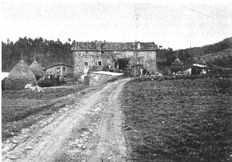
La célèbre Masia de Can Grivé

Pel març del 1482 fou trobat un home mort a Roca. Havia estat enviat per complimentar similar comesa cap a la part de Mieres. També el