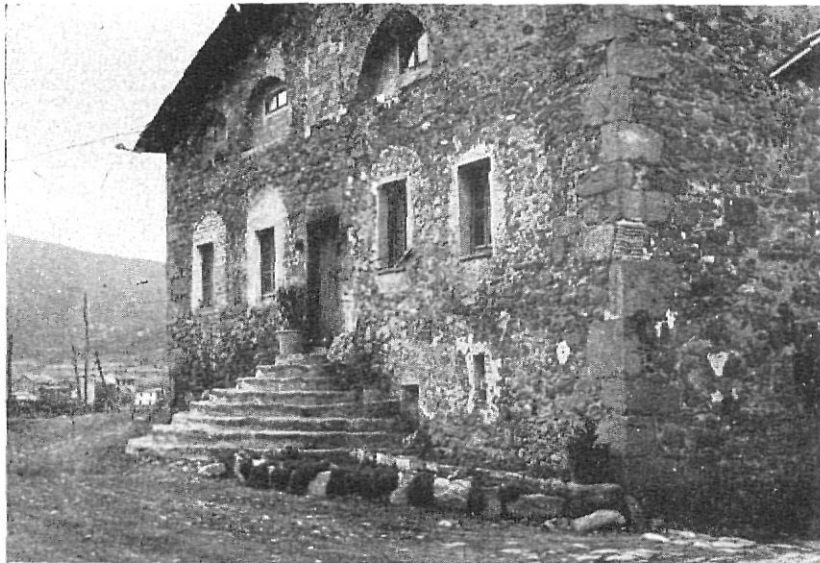
Masia de Can Grivé