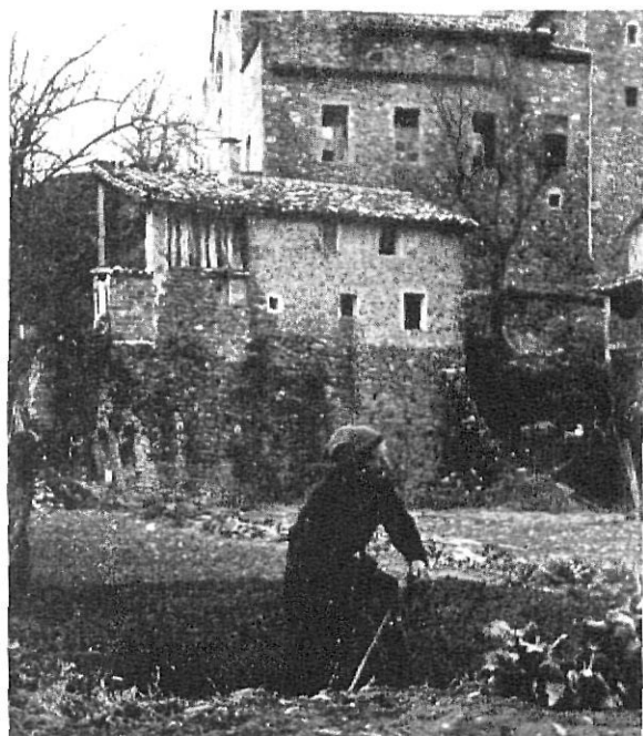
Un típic mierenç

Acabada la primera etapa de la Reconquesta (Segle XIè) i colonització del Principat, el fenòmen de repoblació deixà d'influenciar sobre l'estructura social i agrària. Desaparegué la primitiva llibertat i els pagesos (que eren nombrosos), com més anava, més depenien dels senyors (noblesa, monestirs). Malgrat això, quan a l'any 1068 varen completar-se els Usatges promulgats