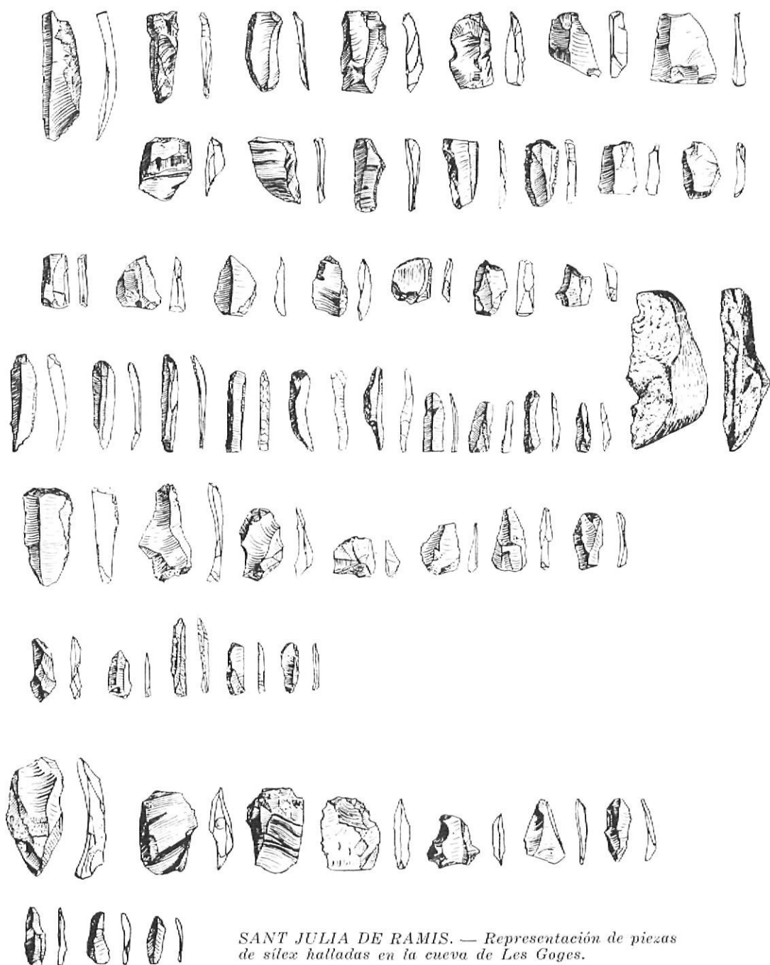
SANT JULIA DE RAMIS. — Representación de piezas de sílex halladas en la cueva de Les Goges.