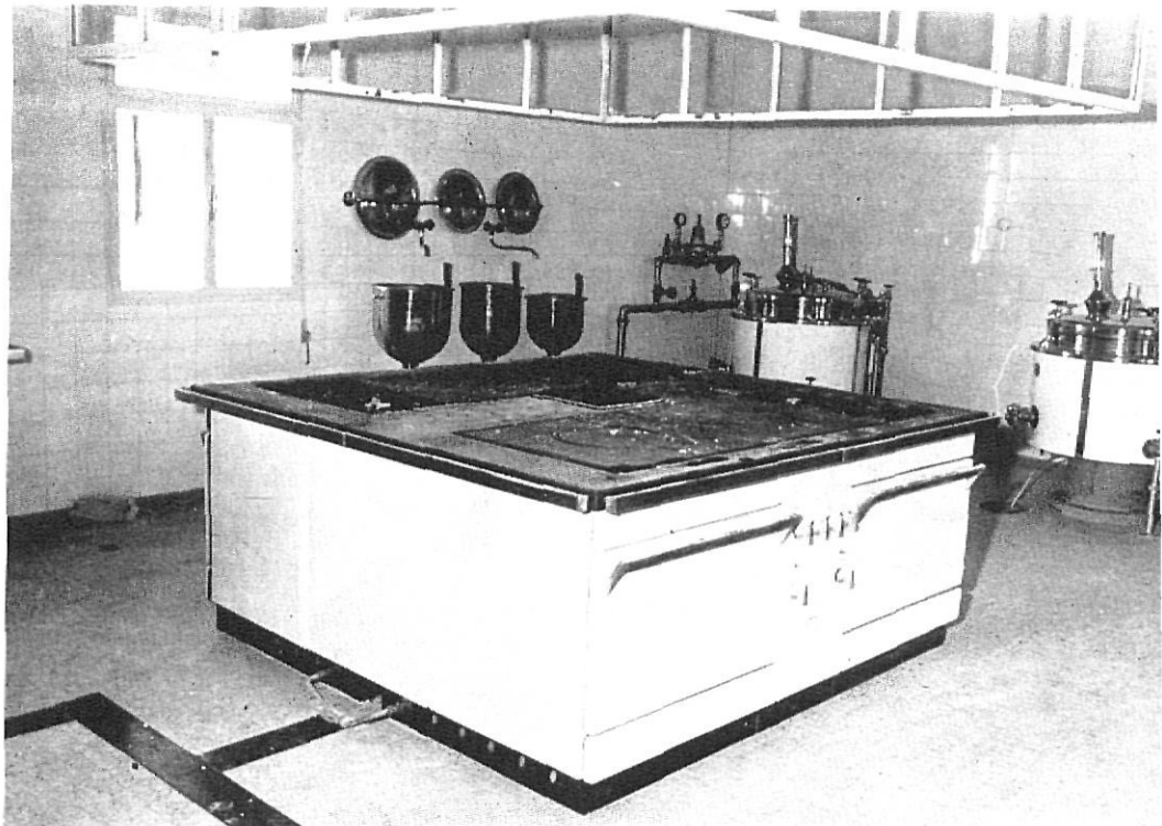
Las magníficas y modernas instalaciones de la cocina

En la actualidad hay cabida para 330 residentes, no obstante caso de ser necesario, el edificio tal como se ha indicado es lo suficientemente amplio para poder rebasar la cifra de 400 acogidos.