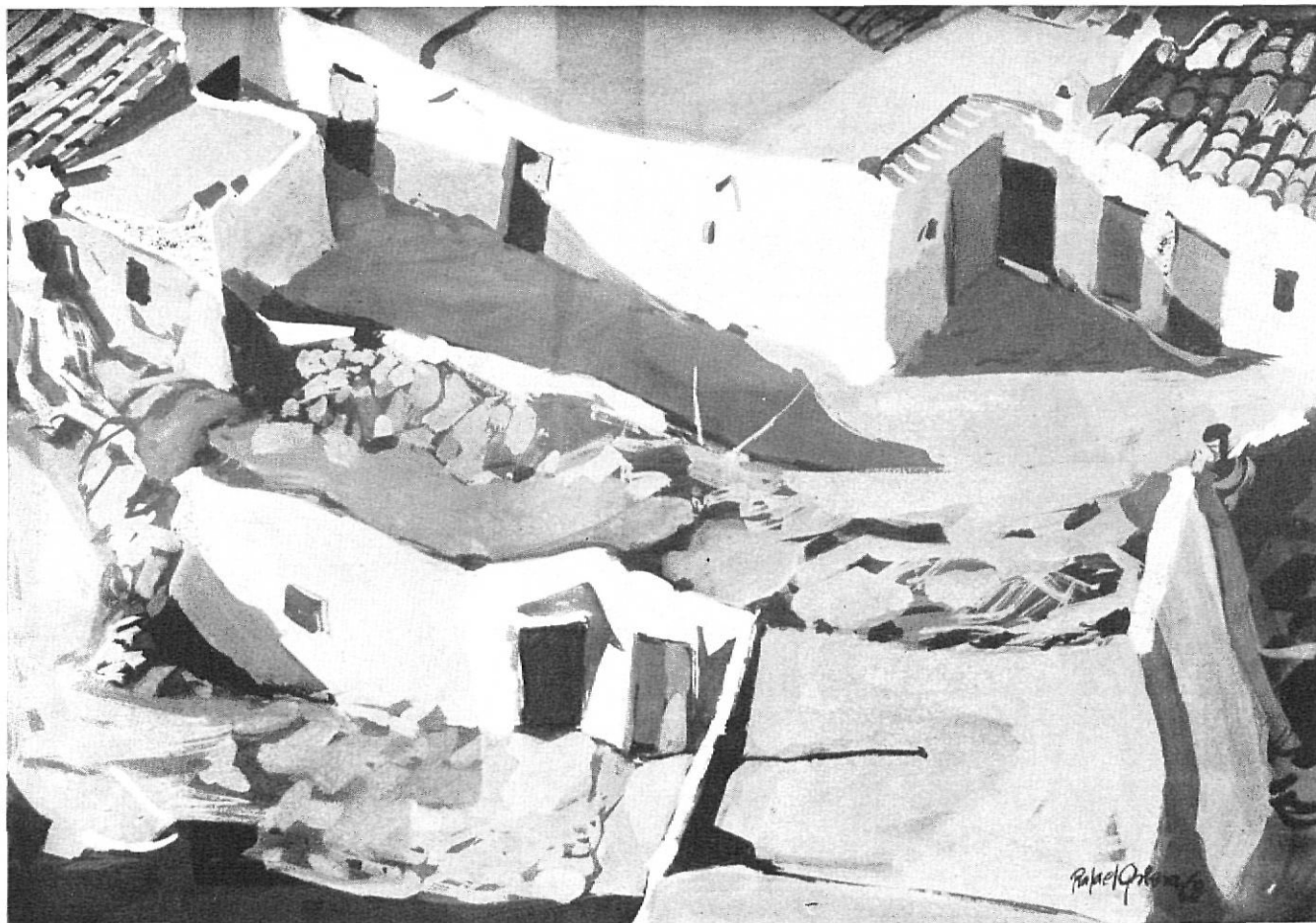
PATIOS. — Rafael Griera. — Primer Premio Acuarela