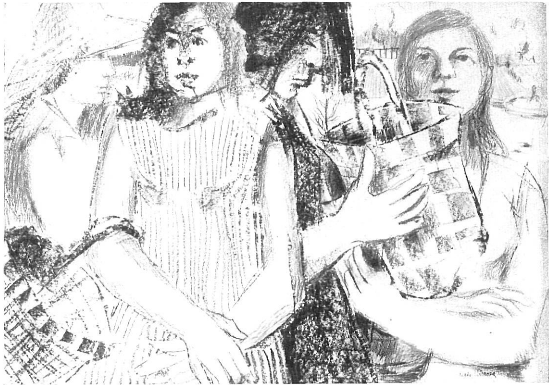
JARDIN. — Granados Llimona. — Primer Premio Dibujo