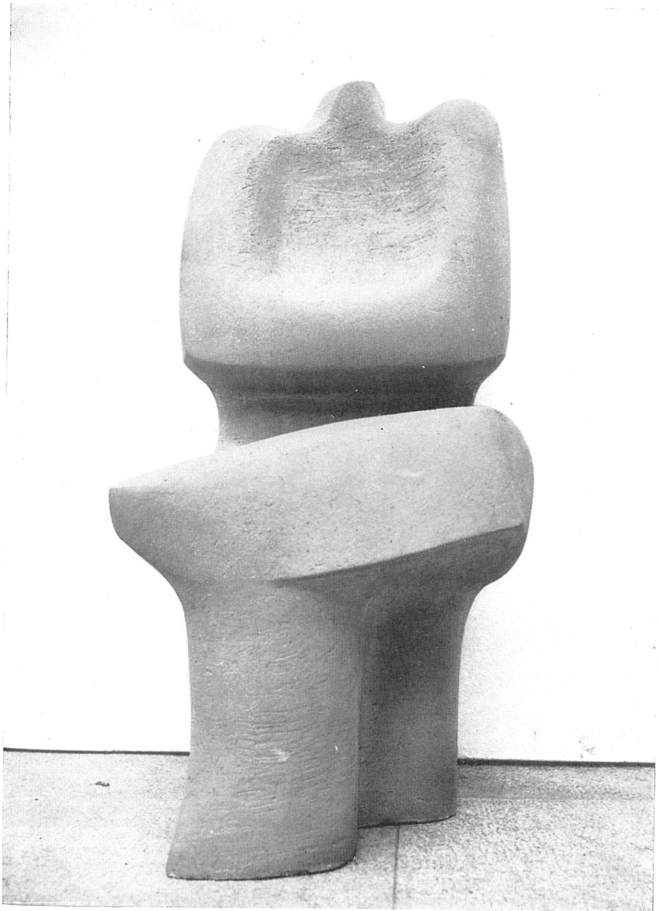
"L'EXPECTACIO DEL MON", — José Martínez Noguera. — Primer Premio Escultura