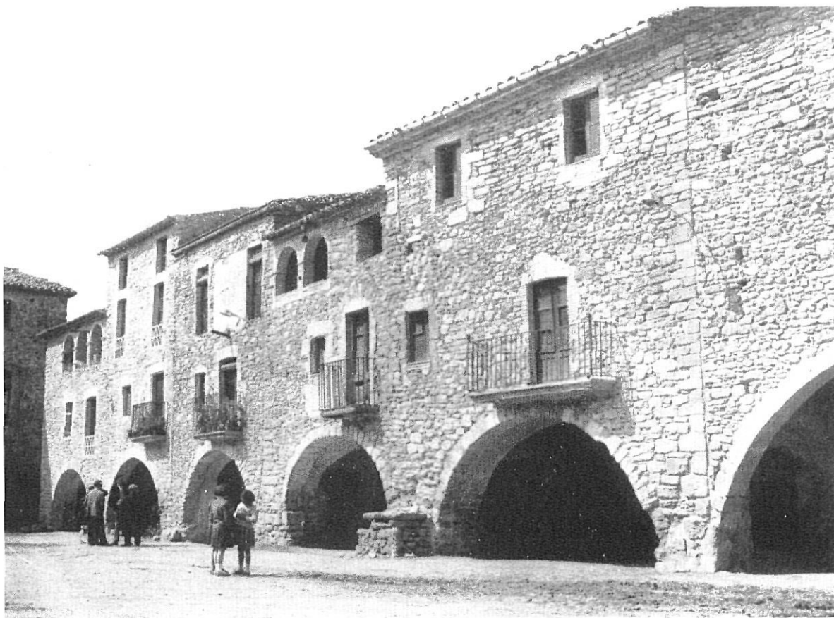
MONELLS.— Plaza Mayor (porticada)

La Institución «Fernando el Católico» se mostró dispuesta a habilitar, para tal finalidad, la sala de exposiciones de que dispone en el Palacio Provincial de Zaragoza, en donde los asambleístas podrían conocer, ordenadas adecuadamente, la gama de actuaciones y los sistemas de trabajo utilizados por cada Instituto en sus labores.