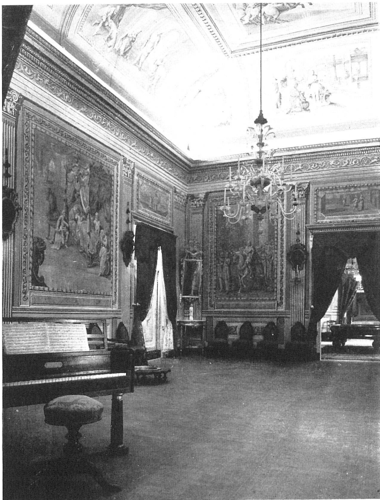
VILLANUEVA Y GELTRÚ. - Museo romántico «Casa Papirol»