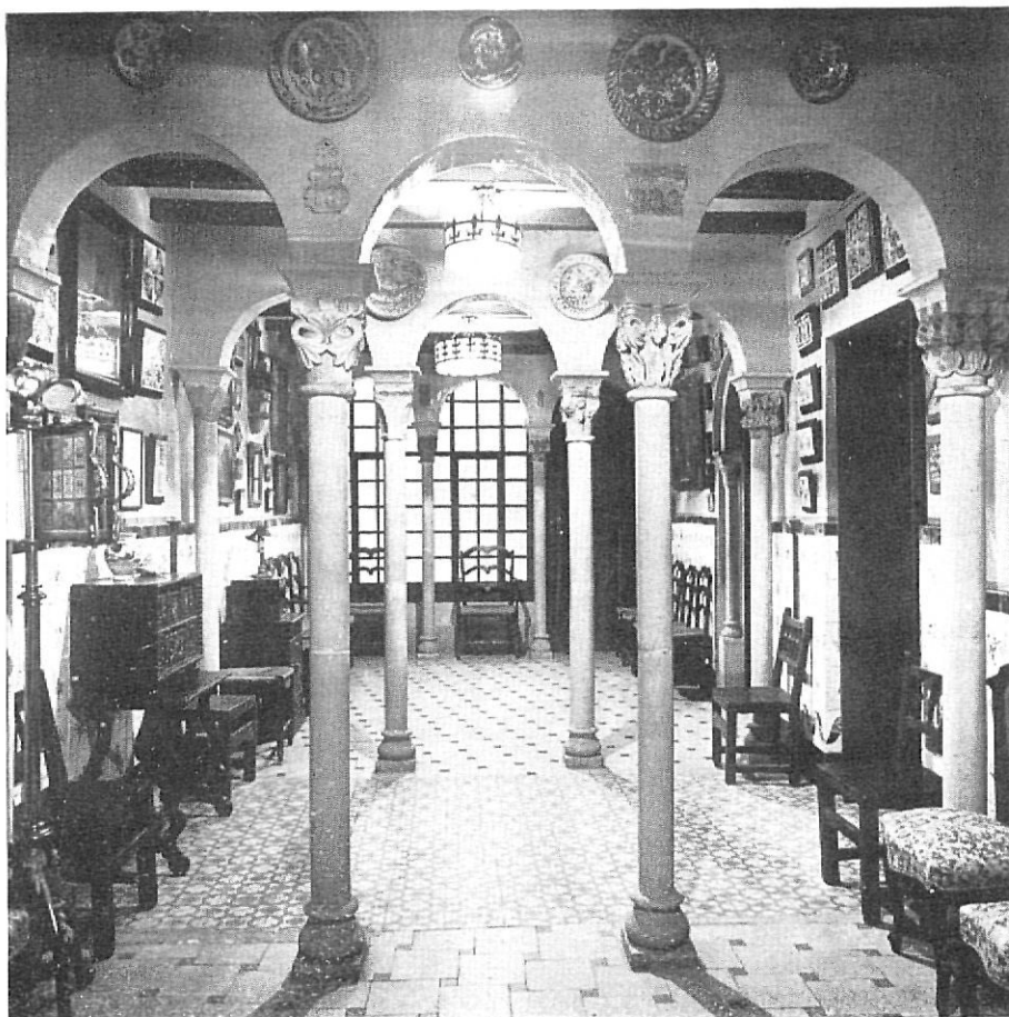
MARTORELL. - «Enrajolada»

edificio será inaugurado dentro de breves semanas.