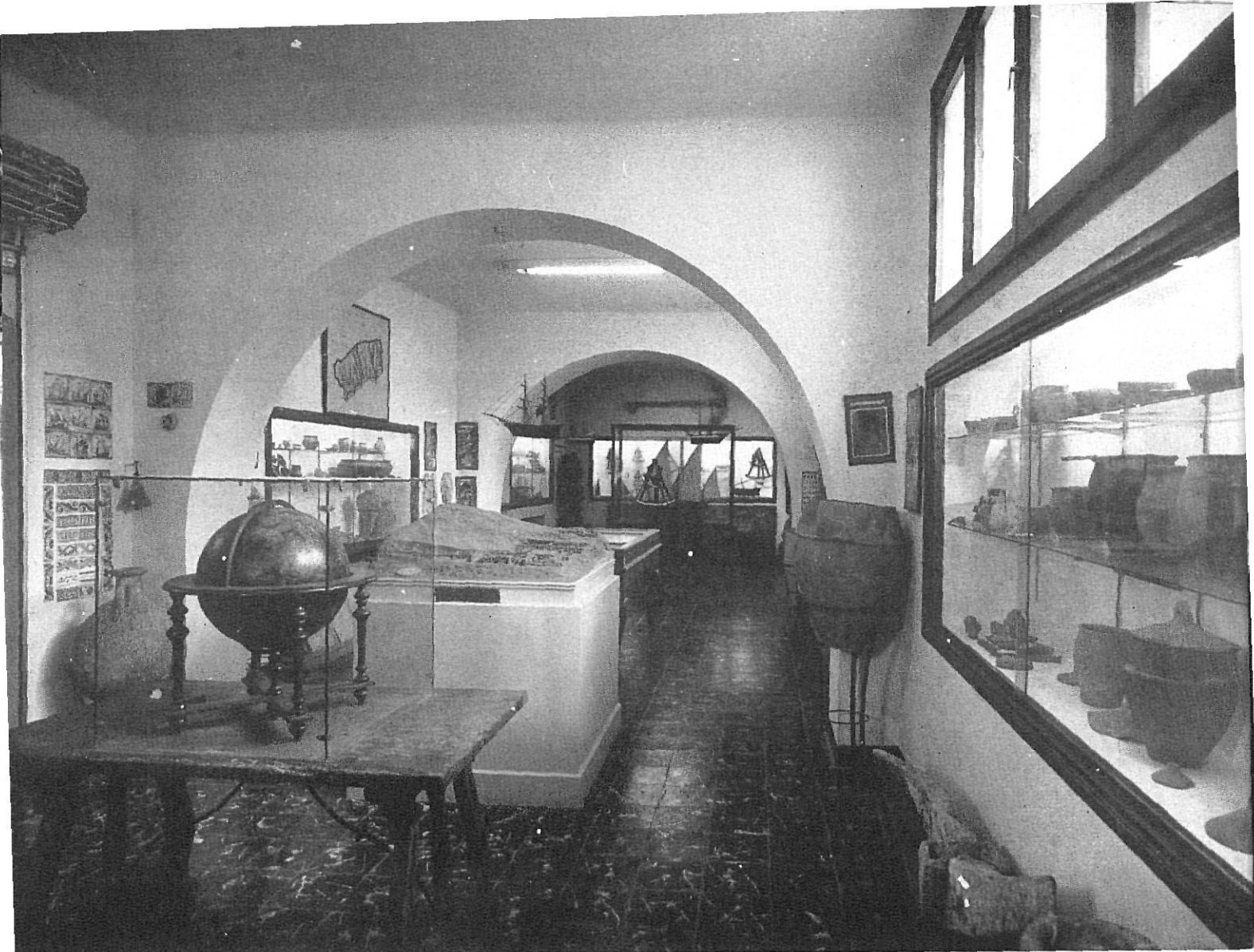
ARENYS. - Museo Marítimo