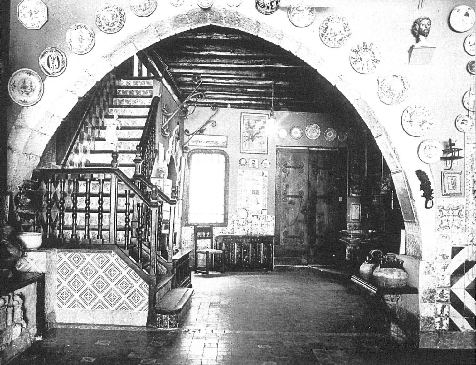
Sitges. - Cau Ferrat

se adquieren anualmente. El Instituto cuenta asimismo con un servicio de restauración, laboratorio fotográfico, estudio de dibujo y numerosos archivos y publica aparte de la mencionada revista una extensa gama de obras de alto valor científico. Realiza excavaciones en diversos puntos de la península, superando así su ámbito propio, que es la provincia de Barcelona.