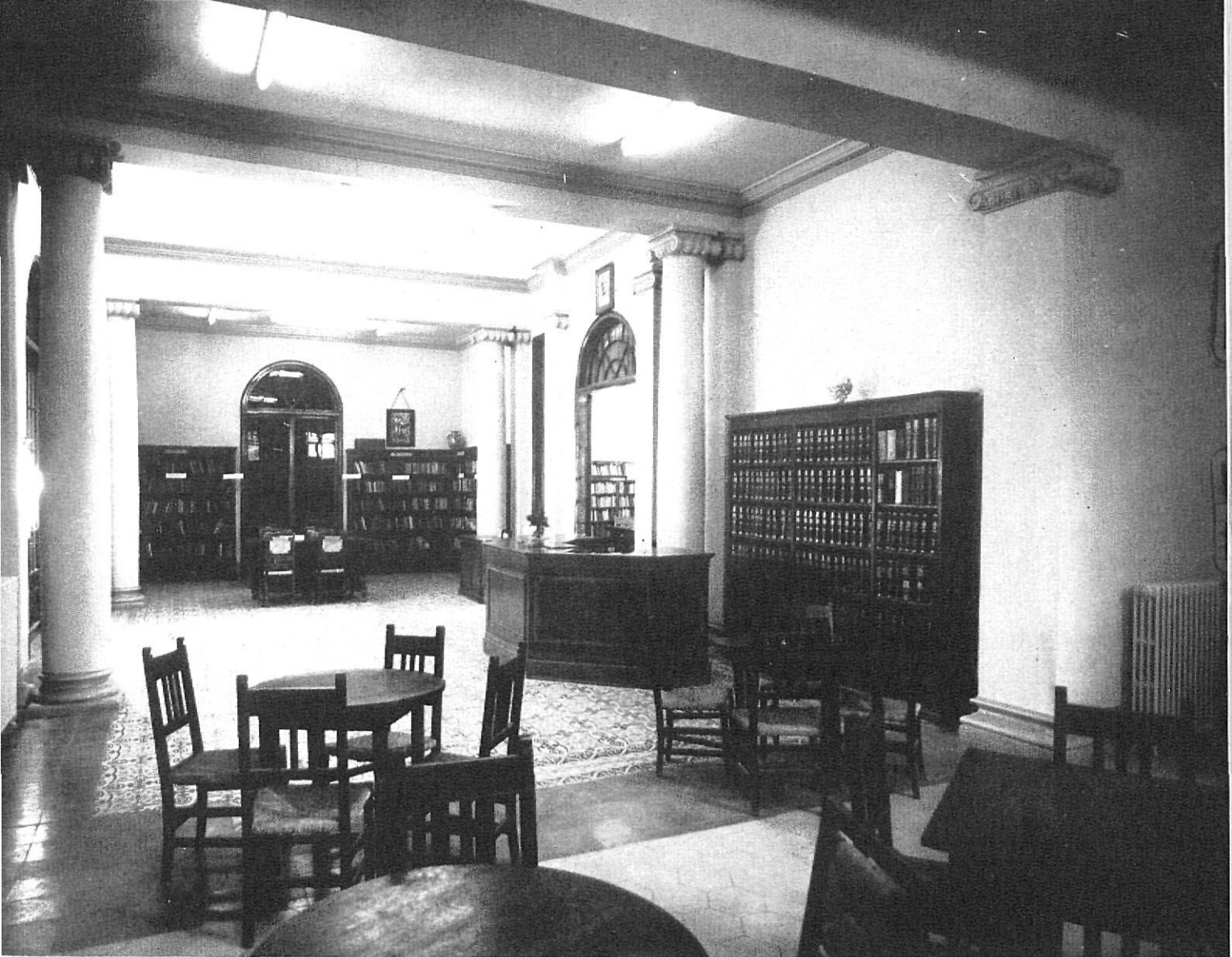
SALLENT. - 1. a Biblioteca Popular fundada en 1917

manas Internacionales» que se celebran cada año. Además hay una serie de actividades internas tales como la labor de seminarios de estudio y la formación de biblioteca especializada.