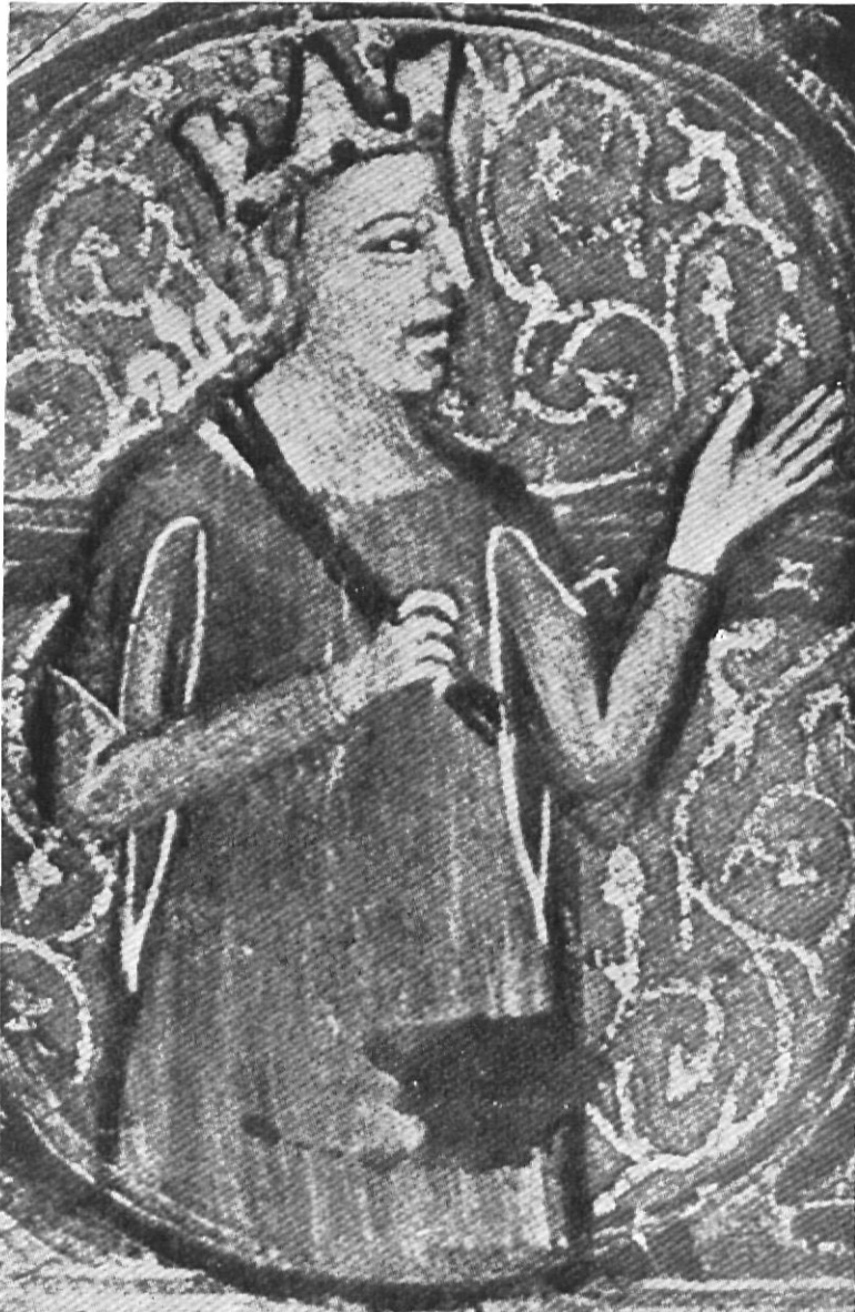
Retrato de Jaime I el Conquistador, según grabado del libro: "Jaume I - Pere el Gran", de F. Soldevila.

sa, y la obra de Federico García Lorca, « La Casa de Bernarda Alba », en la misma plaza del Generalísimo. Hubo también un festival folklórico, de música moderna y un Concierto de música, por la Orquesta de Cámara del Patronato de la Excma. Diputación provincial, en los Claustros de la Iglesia Parroquial de Santa María de Vila-bertrán.