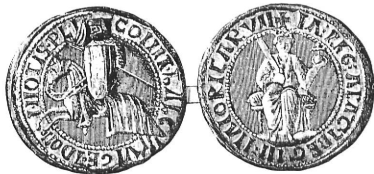
Sello del Rey Jaime I, de origen anterior a la Conquista de Valencia, cuya leyenda dice:

(Sigillilun) Jacobi Regis Aragonum et Majoricarum Comitis Barcinone et Urgelli et Domini Montispesulani