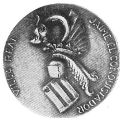
Avverso y reverso de la Medalla Conmemorativa del VII Centenario "Figueras Vila Real".