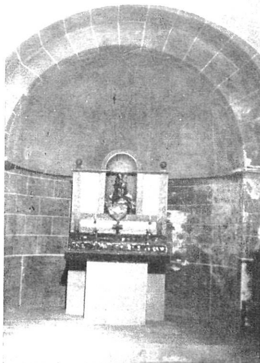
Interior de la iglesia

En la calle de la Clavería de nuestra ciudad, formando parte del Colegio de los Hermanos Maristas, existe una casa donde puede verse, en puertas y ventanas, el escudo heráldico de la casa de los Cartellá. Sin duda debió de ser residencia de alguna rama de esta familia.