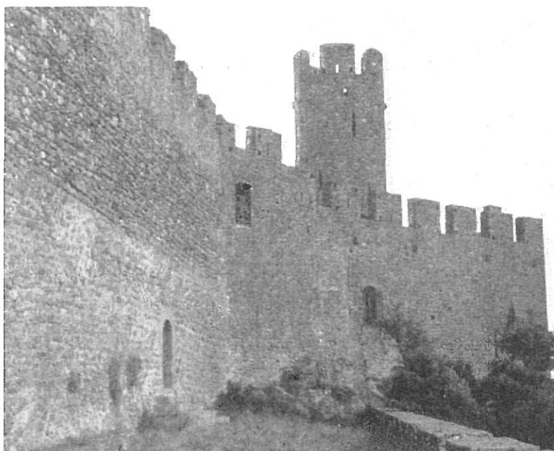
Murallas del castillo de Requesens