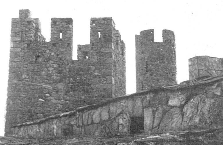
Torre del homenaje

cipado de Cataluña”, cuya primera edición es del año 1657, trata ampliamente de esta iglesia de Requesens, dedicada a la Virgen. Describe con todo detalle esta imagen, cuya fiesta se celebraba el día de la Natividad de la Virgen, siendo muy venerada no solamente por los feligreses de las parroquias cercanas de la comarca del Ampurdán, sino también por otros pueblos como el de la Roca, cuyos vecinos, a pesar de pertenecer al obispado de Elna, sentían profunda devoción por la Virgen que en el santuario de Requesens se veneraba. En determinadas festividades o días del año, tradicionalmente señalados, acudían a visitarla, en devota peregrinación, numerosos fieles de aquellas parroquias (n. 26).