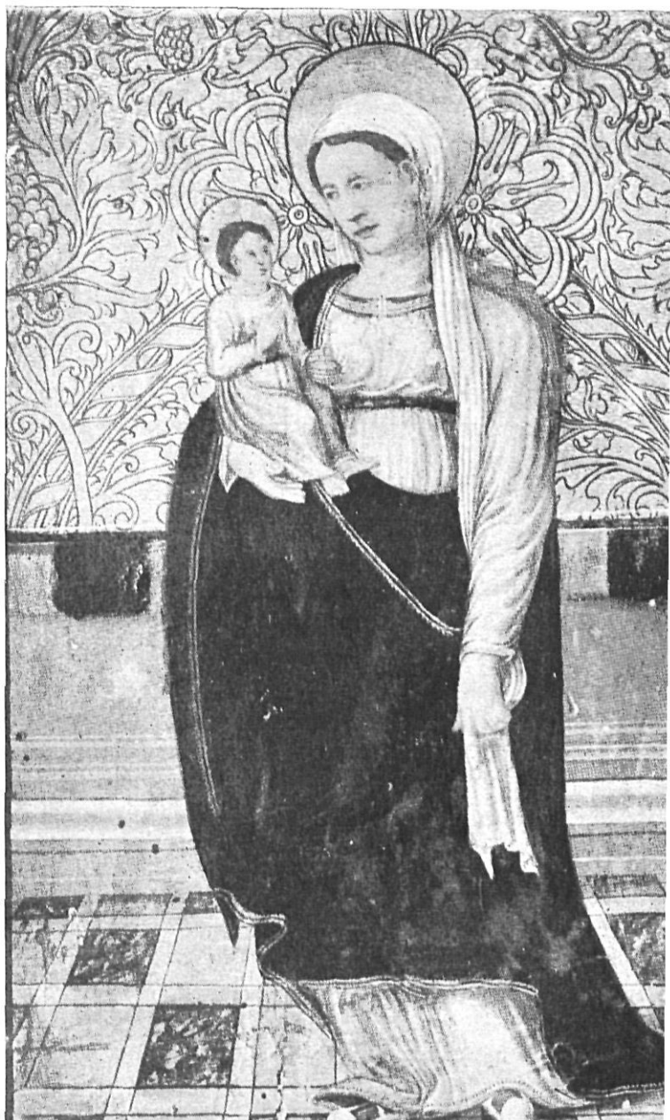
Tabla del primitivo retablo que existía en la Casa Consistorial de Gerona. Museo Provincial.

Las caras de los Santos representados, nos las ofrece casi siempre dentro el que podemos calificar esquema triangular, siendo otra de sus características, la predilección que parece tener, al representar algunas de sus figuras, con anchas espaldas.