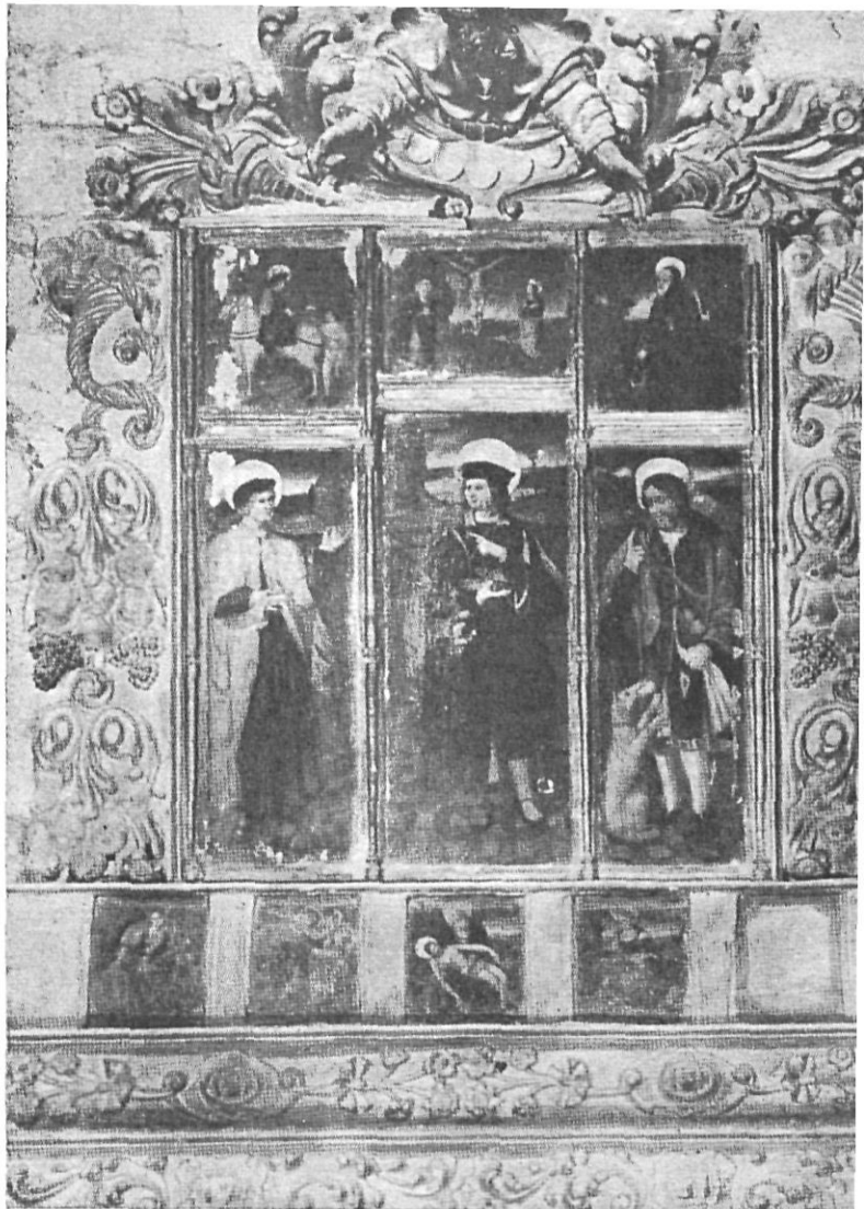
Conjunto del Retablo de Lledó. Antes de 1936.

En la predela del conjunto primitivo, solo existían cuatro plafones pintados, en los que se representaban, María Magdalena; San Cristóbal, llevando en hombros al Divino Niño; La Piedad; Santa Lucía; quedando sin pintar, el plafón siguiente.