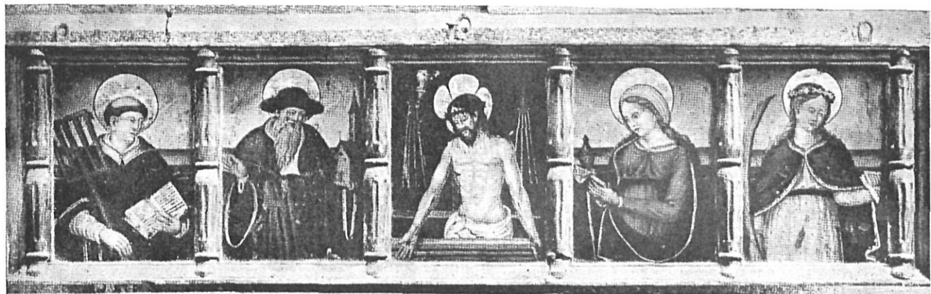
Predela suelta de la Colegiata de San Félix de Gerona.

Es estudio anatómico, que tal vez heredó de su Maestro “El Monogramista Catalán”, nos lo presenta el Artista en el enfermo tendido a los pies de San Roque, en el Retablo de Hospitalet.