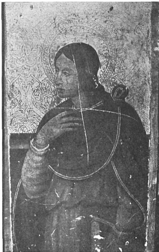
Tabla procedente de la Colección Valls. Museo Diocesano de Gerona.

Con ello, veremos acrecentado el acervo artístico de esta Provincia de Gerona, ya de sí de remarcable interés en el estudio del Arte Hispánico.