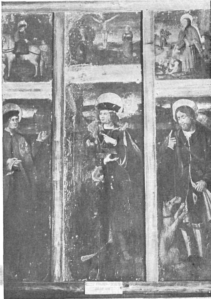
Retablo de Lladó. N.º 327 del Museo Diocesano de Gerona.

Las partes salvadas, y que en la actualidad se hallan en el Museo Diocesano catalogadas con el número 327, consisten en tres tablas que ocupan el camino horizontal central, con la representación de San Damián, San Cosme y San Roque. Ocupando el camino horizontal superior, otras tres tablas, de menores dimensiones, escenifican San Martín, partiendo su capa con el pobre; al centro, la Crucifixión, con la Virgen y San Juan y, en la tercera escena, un Santo Ermitaño, con unos jóvenes arrodillados.