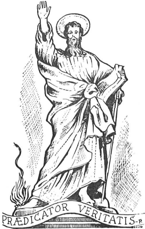
Estatua de San Pablo erigida en Malta.