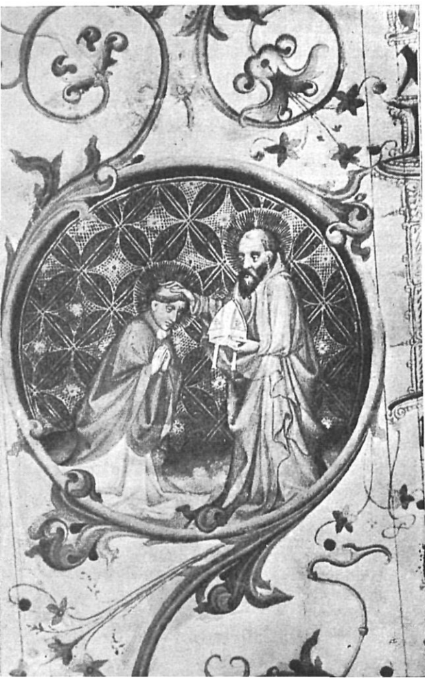
San Pablo en Narbona, camino hacia España, según el Martirologio miniado del Museo Diocesano de Gerona. (A. 1400).

Semproniana , la estación que sigue a Hostalrich en nuestro vaso, estaba en las inmediaciones del actual Granollers, a unos 35 km. de Hostalrich y a unos 75 de Gerona siguiendo un trazado aproximado al del ferrocarril, cuya estación de Granollers dista 70 km. de Gerona. Desde Granollers continuaba hacia Sabadell, con cuya ciudad se ha identificado la ARRAGONE de nuestro itinerario. Allí un ramal de la vía podía desviarse hacia Barcelona mientras que la ruta principal continuaba entre Gelida y Martorell, donde había la estación de AD FINES, hacia Tarragona.