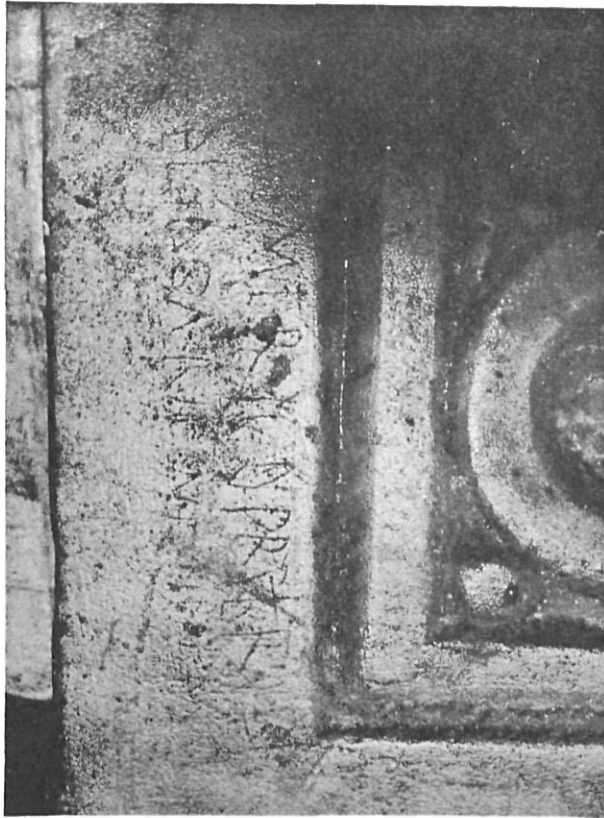
Angulo del ara con el grafito de Ermemiro presbítero.