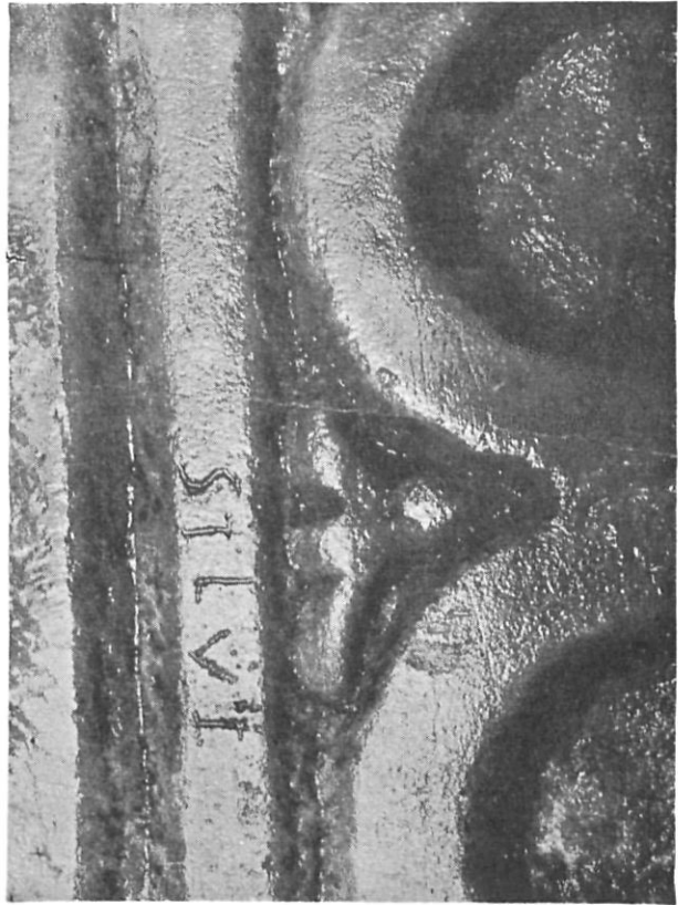
Parte posterior del marco del ara con el nombre de SCLVA.

tal (de aquel condado), hallándose en la oriental memorias continuas de la jurisdicción urgence” (11).