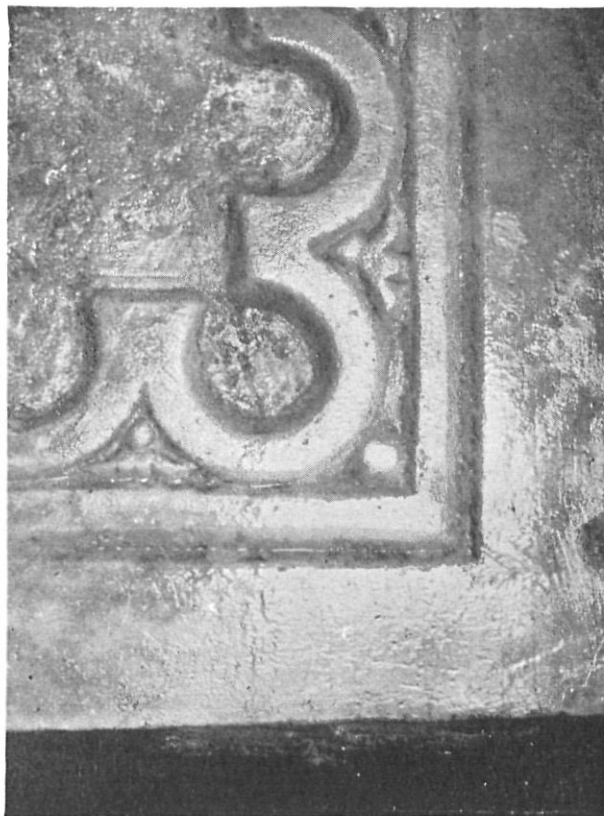
Angulo de la moldura del ara solemne.

igualmente hijo de los expresados Condes (3). Efectivamente, del conde Regimundo (Raymundo), casado con la condesa Ersendis, fueron hijos Atón, Isarno, Hunfrido, llamado por otro nombre Bernardo (4), Guillermo y Audesindo (5).