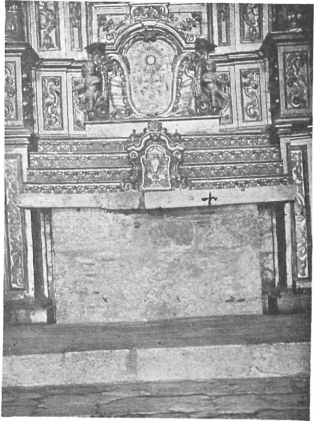
Altar Mayor de la iglesia de San Martín de Ampurias, destruido en 1936, en cuya mesa fue hallada el ara solemne del siglo X.