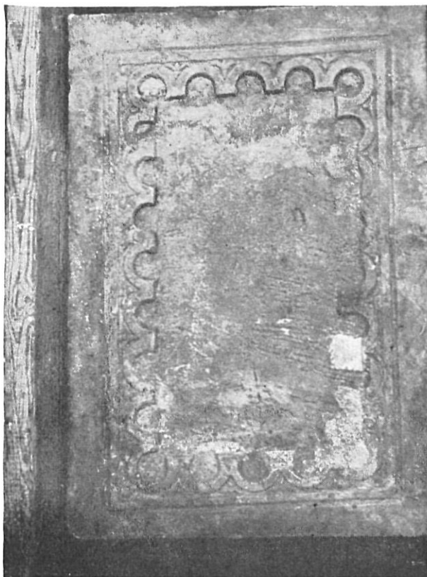
Ara solemne del siglo X enmarcada en arcuaciones románicas.