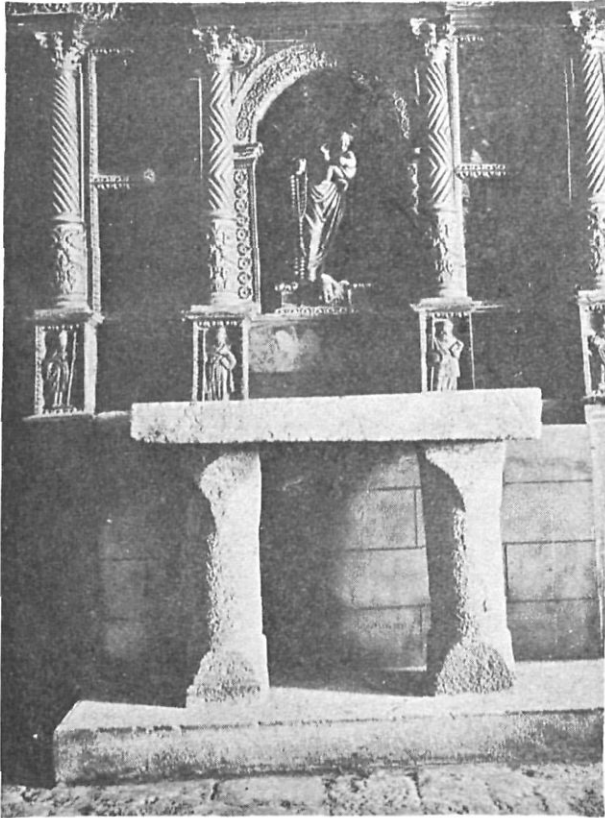
Colocación del ara en un altar lateral, en el año 1039.