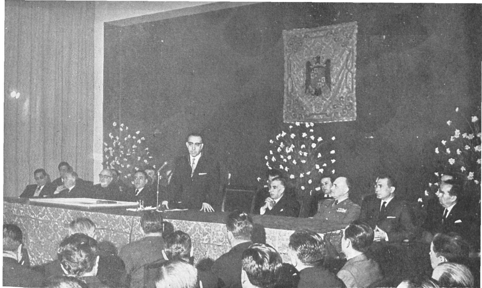
El Subsecretario de Gobernación, pronunciando el interesantísimo discurso, en el que agradeció el nombramiento de Presidente Honorario Vitalicio de la Corporación Provincial.

En esta misma planta se encuentran los servicios médicos de la casa, así como la Administración .