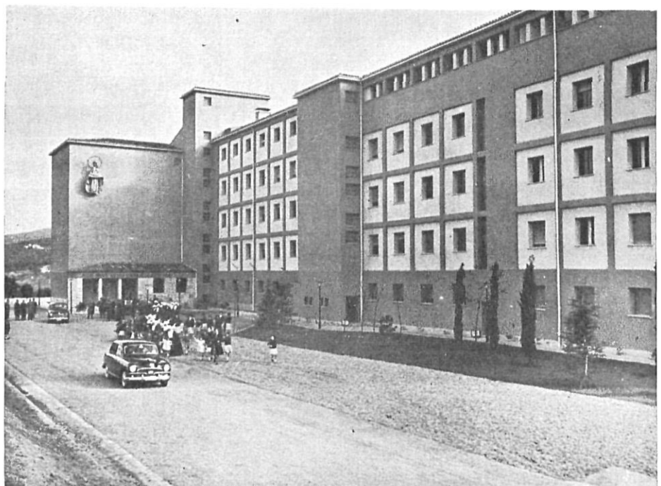
Fachada posterior (Norte del edificio).

Las autoridades y personalidades recorrieron detenidamente las distintas dependencias del nuevo Hogar infantil, sirviéndose a continuación un vino de honor.