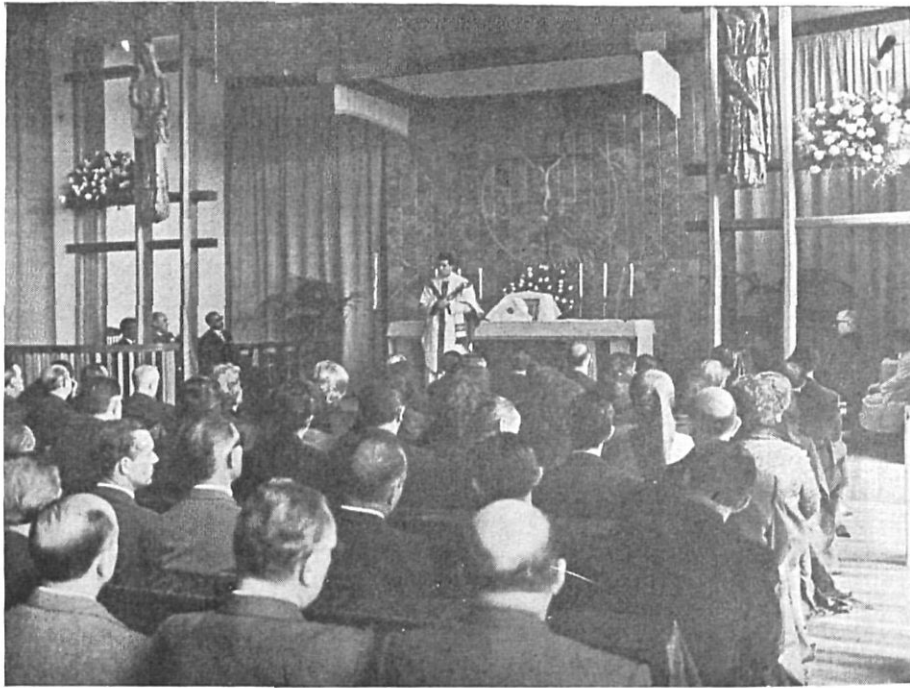
Capilla del nuevo Hogar Infantil. Plática por el Capellán del Centro en la misa del día de la inauguración.

Agradeció el honor con que se le distinguía al ser nombrado Presidente Honorario Vitalicio de la Diputación de Gerona, “distinción que me obliga, —dijo— a vincularme a esta provincia con todo el valor que tiene esta palabra. Yo acepto esta preeminencia con ecuaníme sentido de los propósitos y realidades que pueden ser mis méritos; y por ello —añadió— más que en pago de los menguados servicios que pude prestaros, acepto el título e insignias en testimonio del compromiso que contraigo de estar al servicio de tanto como merecéis y de lo mucho que debemos atender esta provincia”.