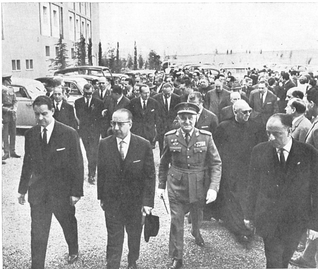
El Subsecretario de la Gobernación y Autoridades provinciales a su llegada al Hogar Infantil.