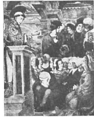
Predicación de San Félix. (Gerona).

Procedente de Tosses, un panel lateral del célebre frontal del altar, obra del llamado Maestro de Soriguerola, del siglo XIII.