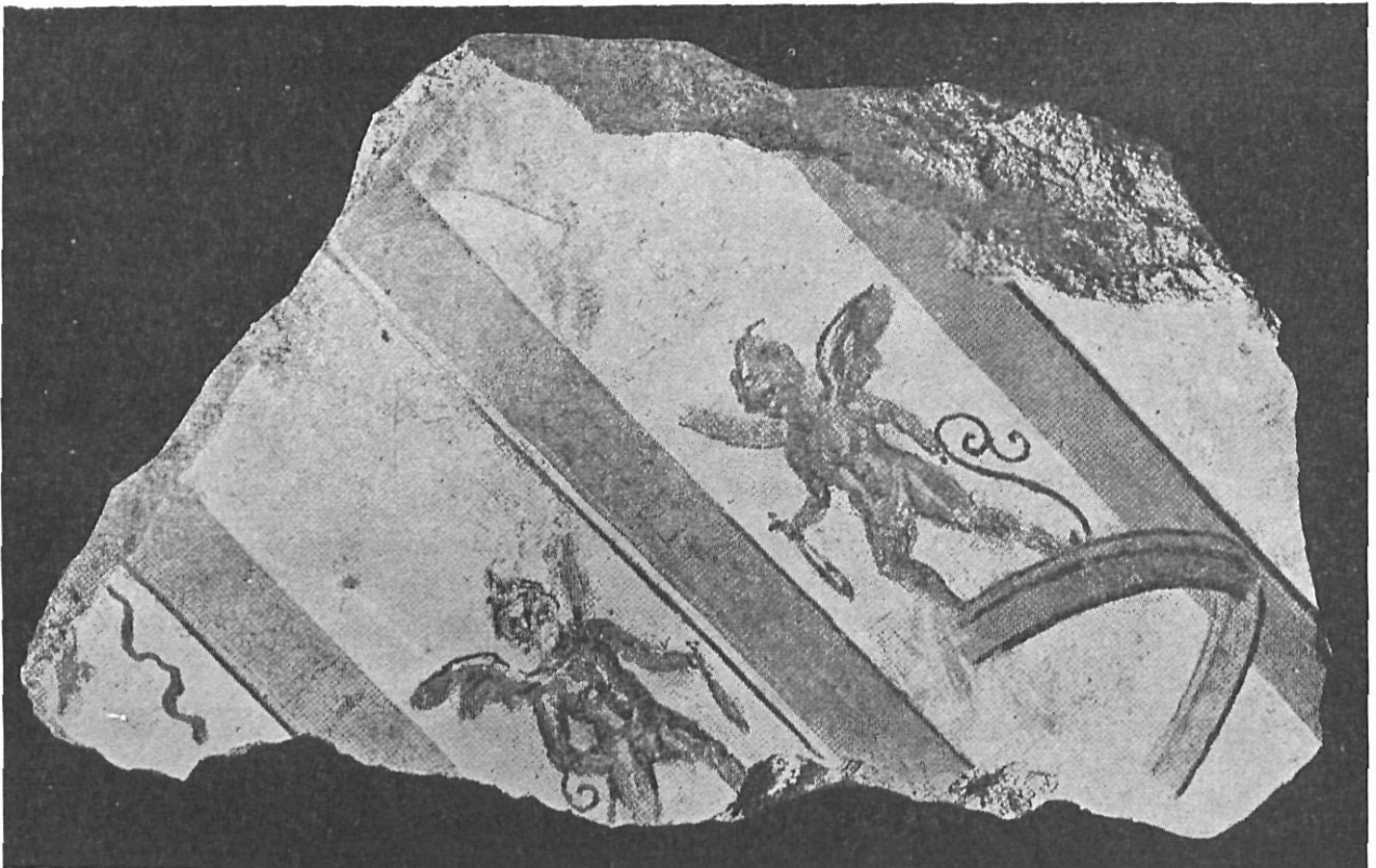
Genios alados. Pintura al fresco.

Las pinturas murales prerrománicas de la iglesia arruinada en despoblado de Campdevanó, posiblemente de los siglos IX-X, son presentadas a base de una fotografía coloreada, con un pormenor de las mismas.