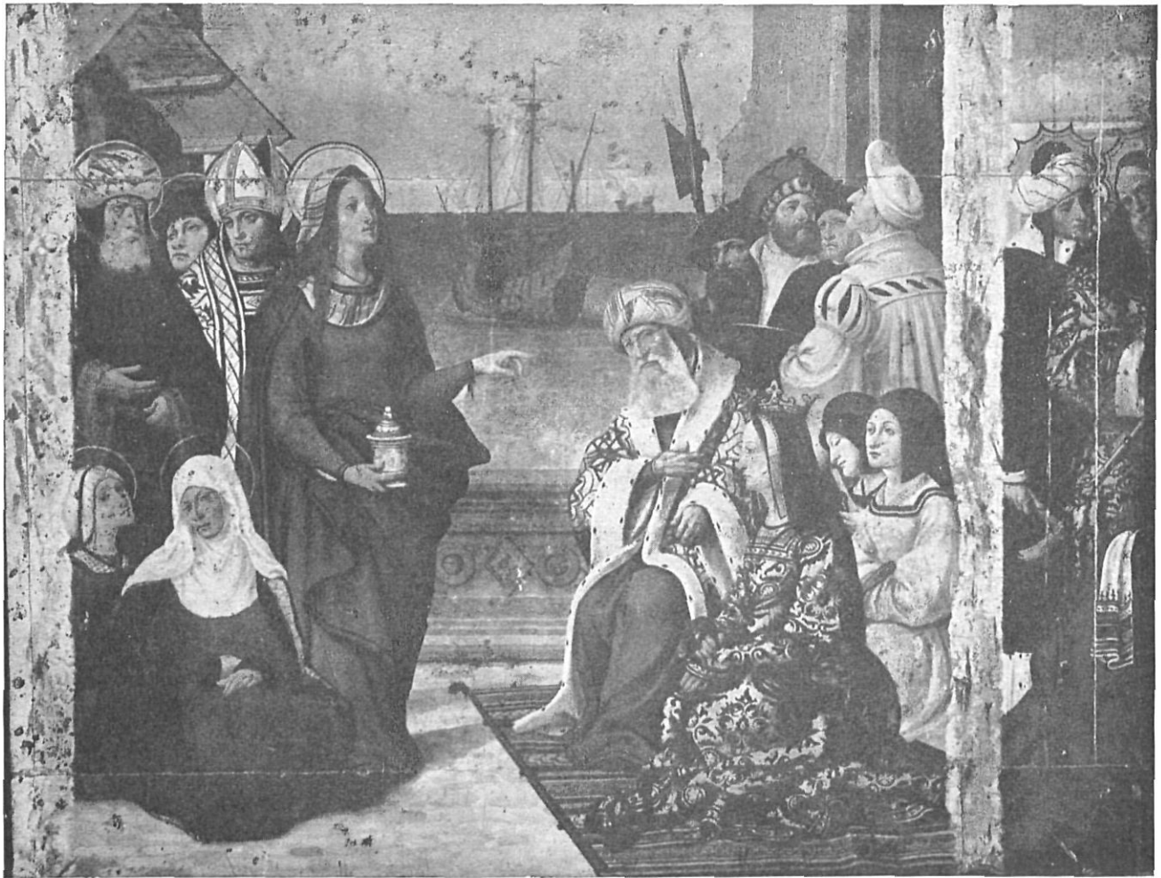
Detalle del Retablo de la Magdalena.

De estos pintores gerundenses y de la posible escuela que salió de sus talleres, otras importantes obras habían podido presentarse, pero la selección entre las 200 que se ofrecieron en esta Exposición, limitó a los organizadores en su labor.