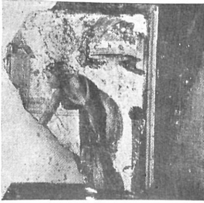
Figura de mujer. Pintura al fresco. (Ampurias).