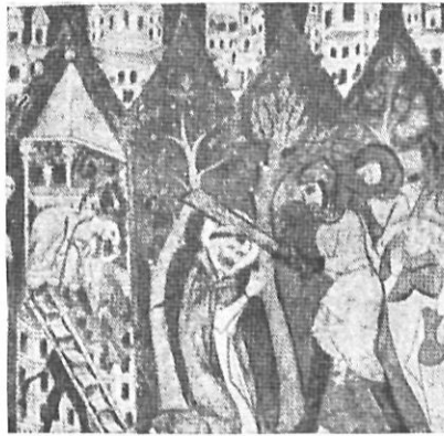
Pintura al fresco, procedente de Puigcerdá. (Museo Provincial, Gerona).