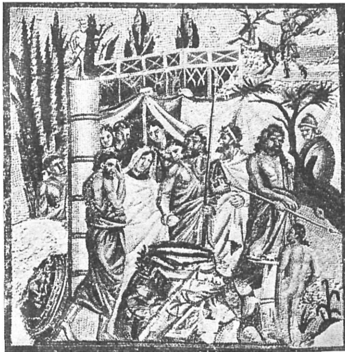
Sacrificio de Ifigenia.

PROFESOR DE HISTORIA DE ARTES DE LA ESCUELA DE ARTES Y OFICIOS DE FIGUERAS