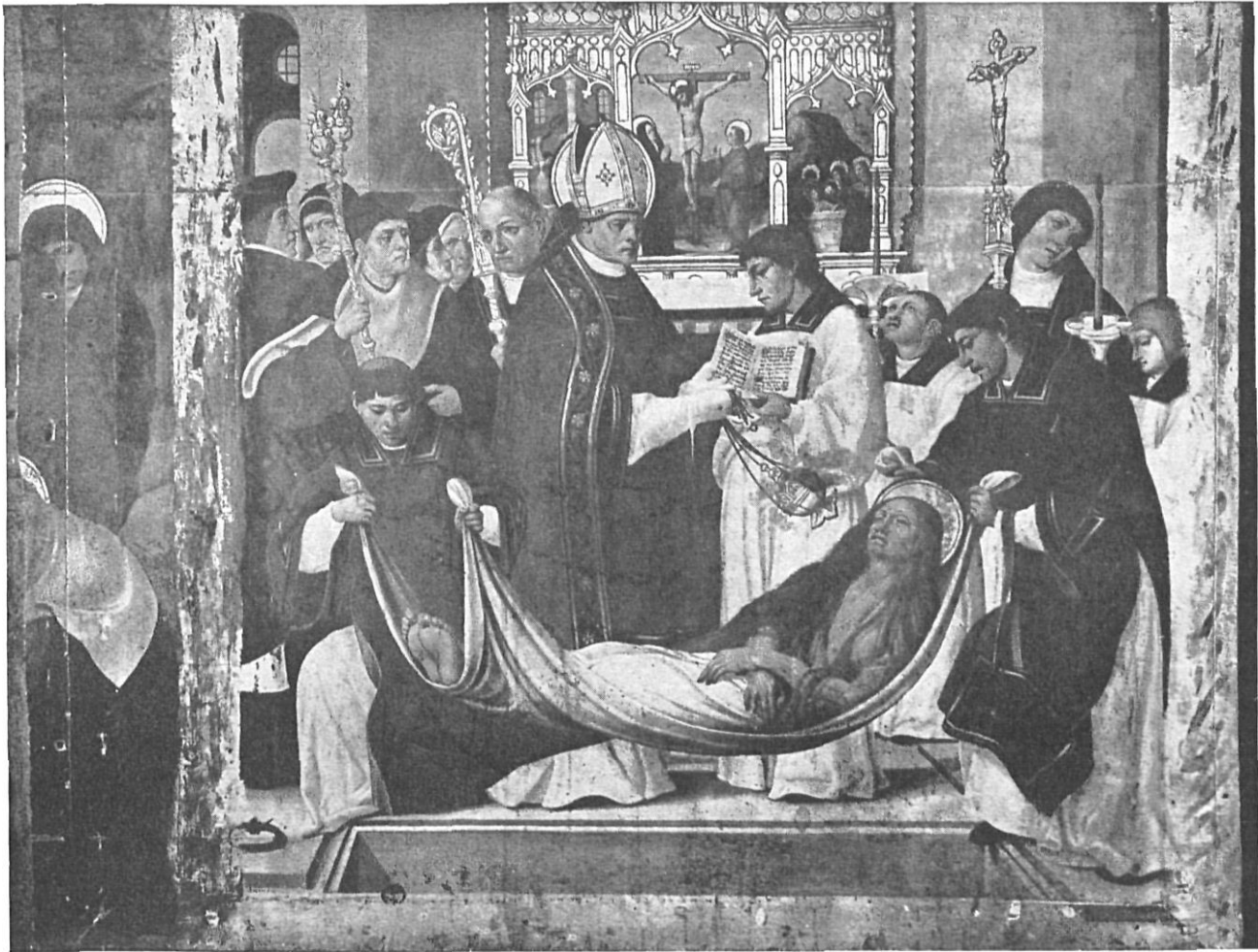
Detalle del Retablo de la Magdalena.