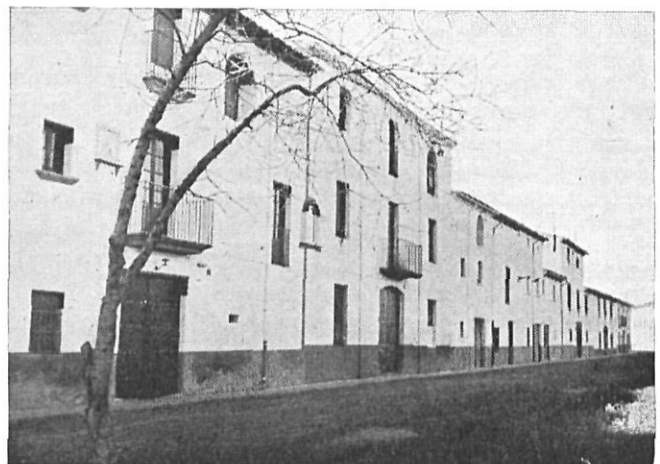
Cornellá de Terri.

han sido rescatados del olvido. Casa típica de S. Esteban de Guialdes, con su cocina en servicio desde el siglo XVIII. Las mismas parrillas y la misma mesa a la que se sentaron, casaca y peluca, sus primeros propietarios, quizá para leer las sorprendentes nuevas del “tiempo de las luces”. Junto al Alcalde de Vilademuls, gran señor y ducho en señoriales saberes, la perspectiva de colinas ondulantes se puebla con recias figuras de la historia y la heráldica. En el mismo Vilademuls, la jardinería suaviza la áspera belleza del castillo, con su pendón al viento. Urbanización a conciencia en San Esteban de Bas y Ordís y más arriba el énfasis futurista de Planolas. ¿Quiere usted explicarse? Quiero decir que Planolas, a impulso de