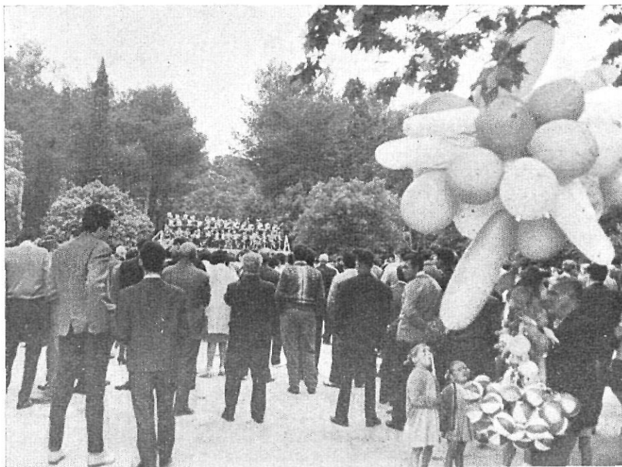
Sardanas en la Fiesta Mayor.

Ahora que la provincia de Gerona se ha convertido en la gran puerta de entrada a