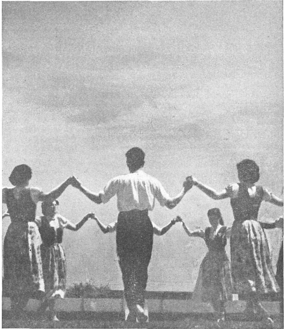
La sardana “la dansa més bella...”

Dentro de las provincias catalanas es innegable que la provincia de Gerona es donde mejor se baila la sardana. Ha sabido mantener su forma tradicional y a pesar de los dos estilos existentes, el “ampurdanés” y el “selvatá”, se han tomado las máximas precauciones para conservar su pureza.