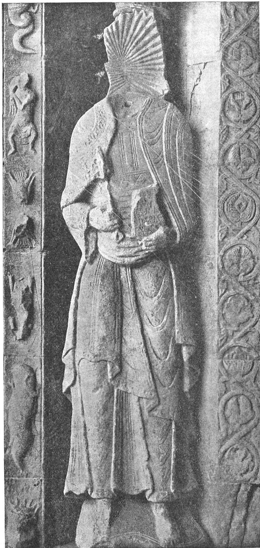
El Apóstol San Pedro en la Portada de Ripoll.

Según testimonios recogidos, las lluvias procedentes de Levante van acompañadas de ráfagas de viento que arrastran el agua desde la puerta del claustro hasta el interior del