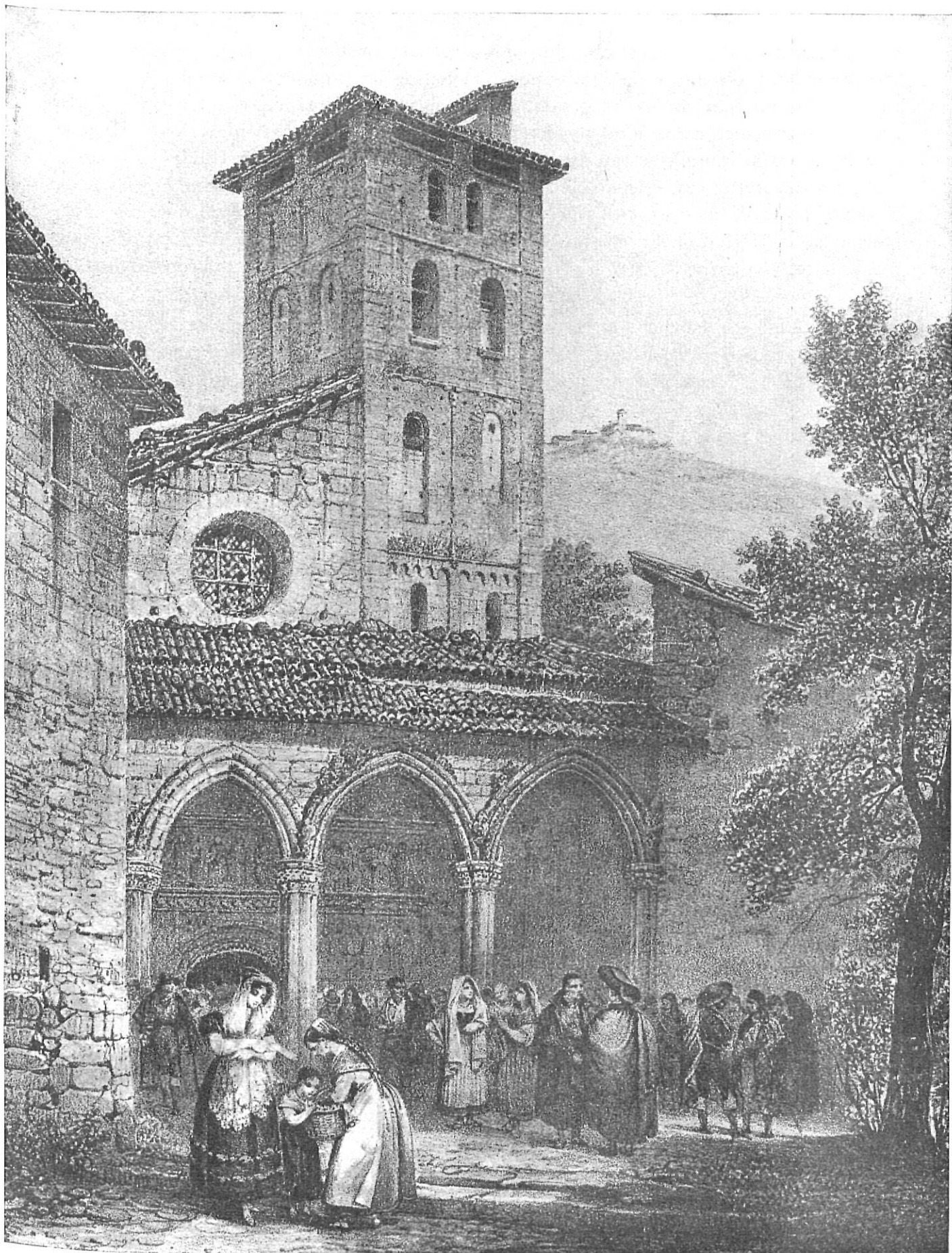
Un grabado antiguo de Santa María de Ripoll.