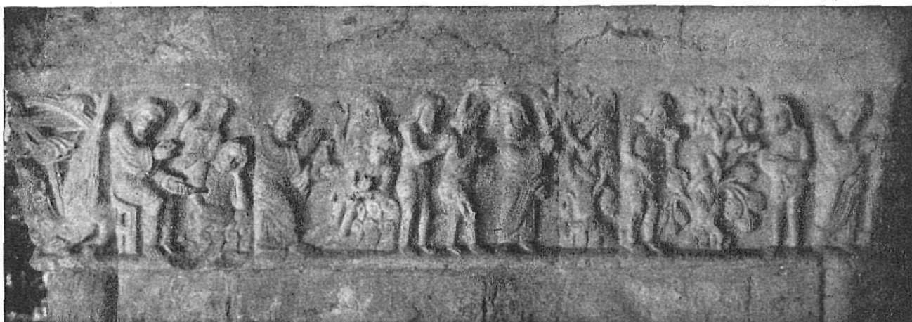
Frisos de la Catedral de Gerona.

No podemos olvidar que, precisamente, este patrimonio debe contribuir a educar y formar las presentes y futuras generaciones a fin de que aprendan a conocer y a estimar como es debido tan altos valores, por lo que son y significan en el orden de la historia secular y en el orden de la cultura, como el más preciado mensaje de esperanza ilusionada. Nos referimos a tantas ciudades, villas fortificadas, catedrales y monasterios cuyos nombres egregios evocan por sí solo páginas gloriosas de nuestra mejor historia: Gerona, Castellón de Am-