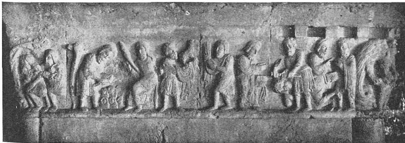
Cain y Abel.

Si examinamos nuestras comarcas gerundenses desde el punto de vista artístico, nos hallaremos en que el actual territorio de la provincia presenta una larga época muy densa que forma un núcleo homogéneo, un todo compac-