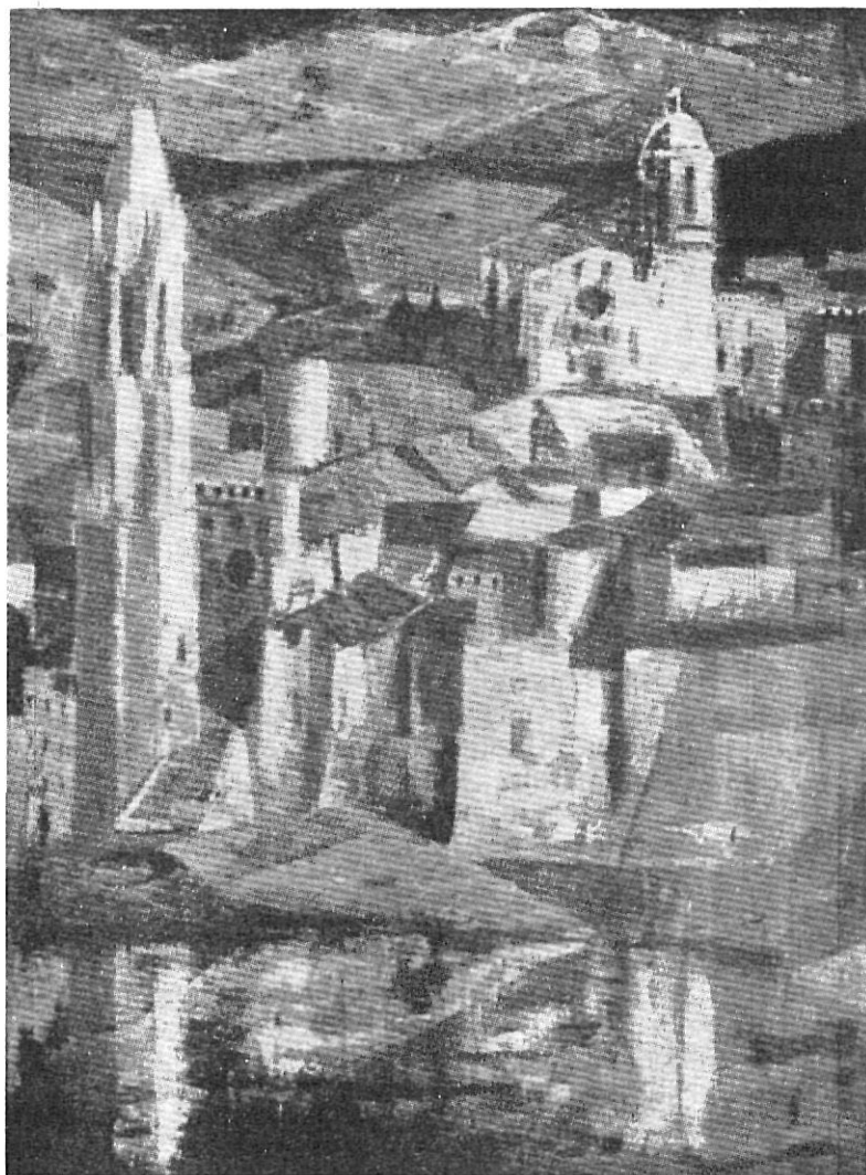
GERONA — Beulas.

bense Beulas se ha operado una sensible variación. Sin dejar de mantener con la mejor pujanza y fuerza la vigorosidad de su colorido y la energía en el trazo y composición ya iniciales en la estructura de sus obras, el pintor ha ido escalonando por las sendas de una abstracción que podríamos llamar muy «sui generis» en la que se nos muestra y aparece con toda su personalidad recia de artista bien construído y ducho, sólido, macizo, fuerte.