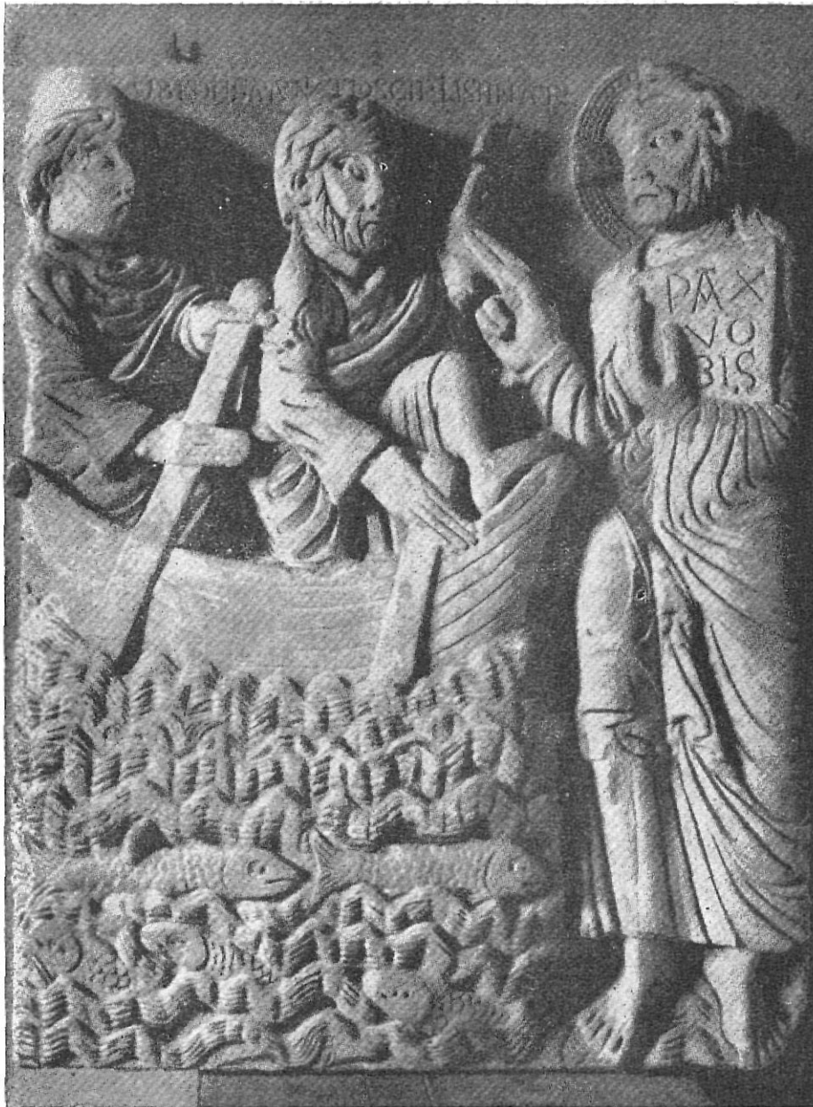
Relieve Vocación San Pedro. "Maestro de Cabestany". Museo Marés, Barcelona).