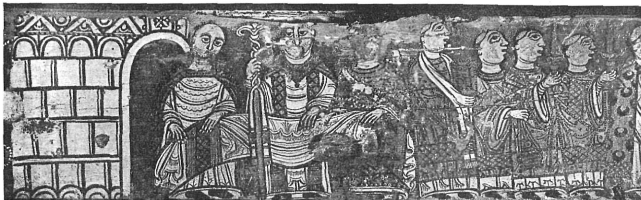
Viga románica del Monasterio de San Miguel de Cruilles.

Procedentes de los famosos «scriptorium» de Ripoll, de San Pedro de Roda, de Gerona, son de gran interés los diversos Códices de los siglos XI-XII.