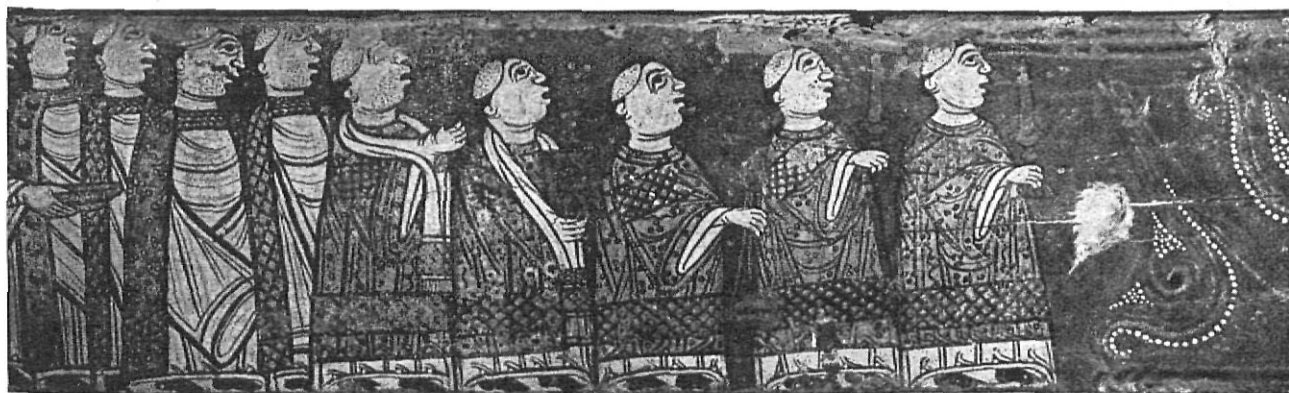
Detalles. (Museo Diocesano, Gerona).

La sala 3 nos permite podamos admirar el Frontal de Llanars y la célebre e interesante viga románica del Monasterio de San Miguel de Cruilles —desgraciadamente algo mutilada en su lado derecho, desconocemos las razones que pudieron haber para ello—,