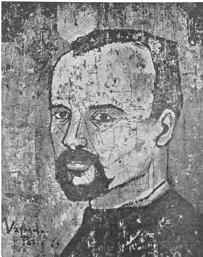
Vayreda — Autoretrato.

Vayreda es un pintor conocido en todas partes por su dicción especial tan característica de una obra muy detallista, cual pudimos ver en su tela premiada «Saint-André des Arts» donde la acertada composición y la riqueza de un vivo y palpante colorido infundía a la tela una creación de mano maestra.