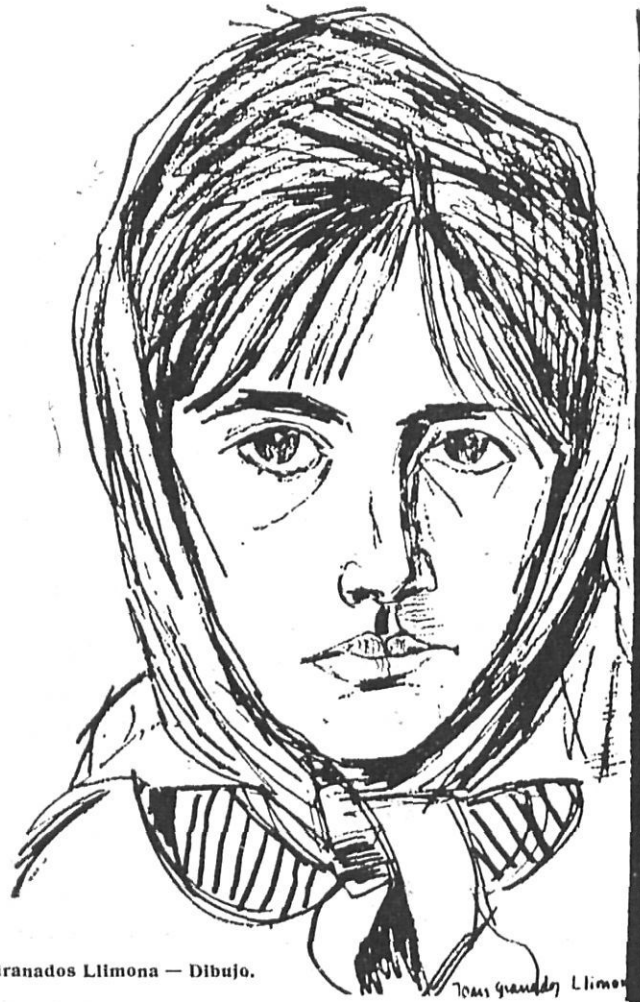
Granados Llimona — Dibujo.