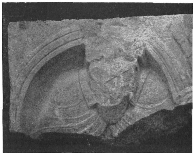
Figuras 8 y 9 — Relieves del toro y del hombre.