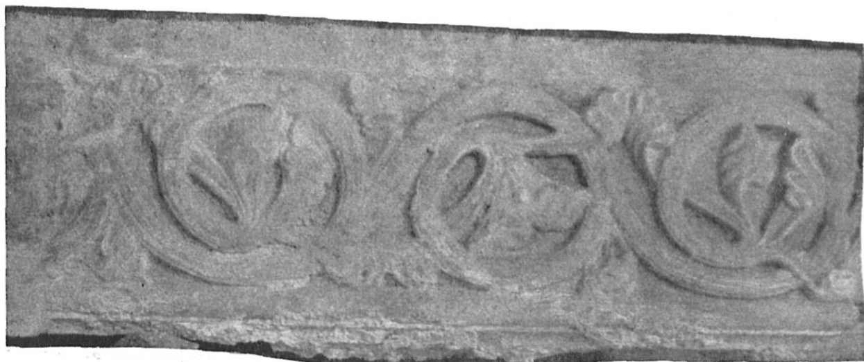
Núm. 1 — Relieve con adornos de motivos vegetales, procedente de la Seo Románica.

Desgraciadamente son escasos los elementos hallados, y la ulterior búsqueda hubiera importado la demolición de importantes estructuras de utilidad manifiesta, cosa ajena al plan de las obras pendientes; pero las piezas descubiertas son ya de capital importancia para precisar ciertos datos históricos de la seo románica de Pedro Rotger.