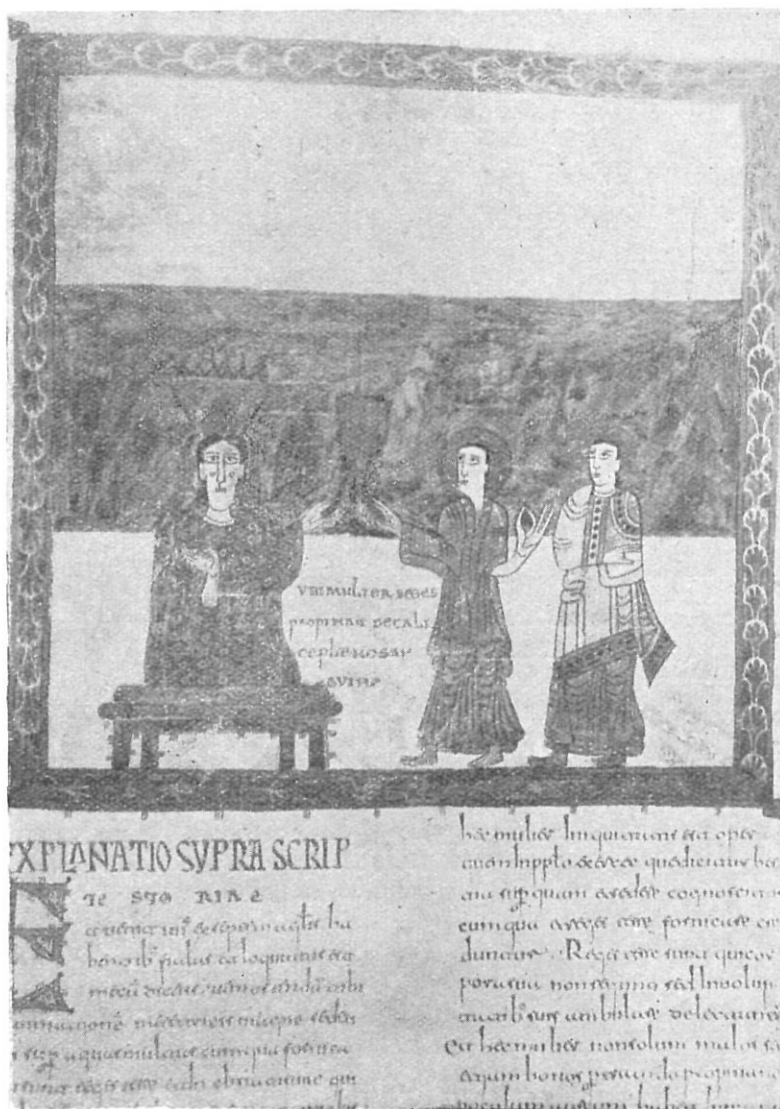
Núm. 4 — Escena de la mujer sentada sobre las aguas, según Beato de Liébana.

«Y vino uno de los siete ángeles que tenían las siete copas, y habló conmigo diciendo: "Ven, te mostraré la condenación de la gran ramera que está sentada sobre muchas aguas, con la cual fornicaron los reyes de la tierra y se embriagaron los que habitan la tierra y se embriagaron con el vino de su prostitución". Y me llevó en espíritu a un desierto. Y vi a una mujer sentada sobre una bestia de color escarlata, llena de nombres de blasfemia, que tenía siete cabezas y diez cuernos. Y la mujer estaba vestida de púrpura y escarlata y adornada de oro y piedras preciosas y perlas, llevando una copa de oro en su mano, llena de la abominación e inmundicia de su fornicación. Y llevaba su nombre escrito en la frente: "Babilonia, la grande, la madre de las fornicaciones y abominaciones de la tierra". Y vi a la mujer ebria de la sangre de los santos y de la sangre de los mártires de Jesús..