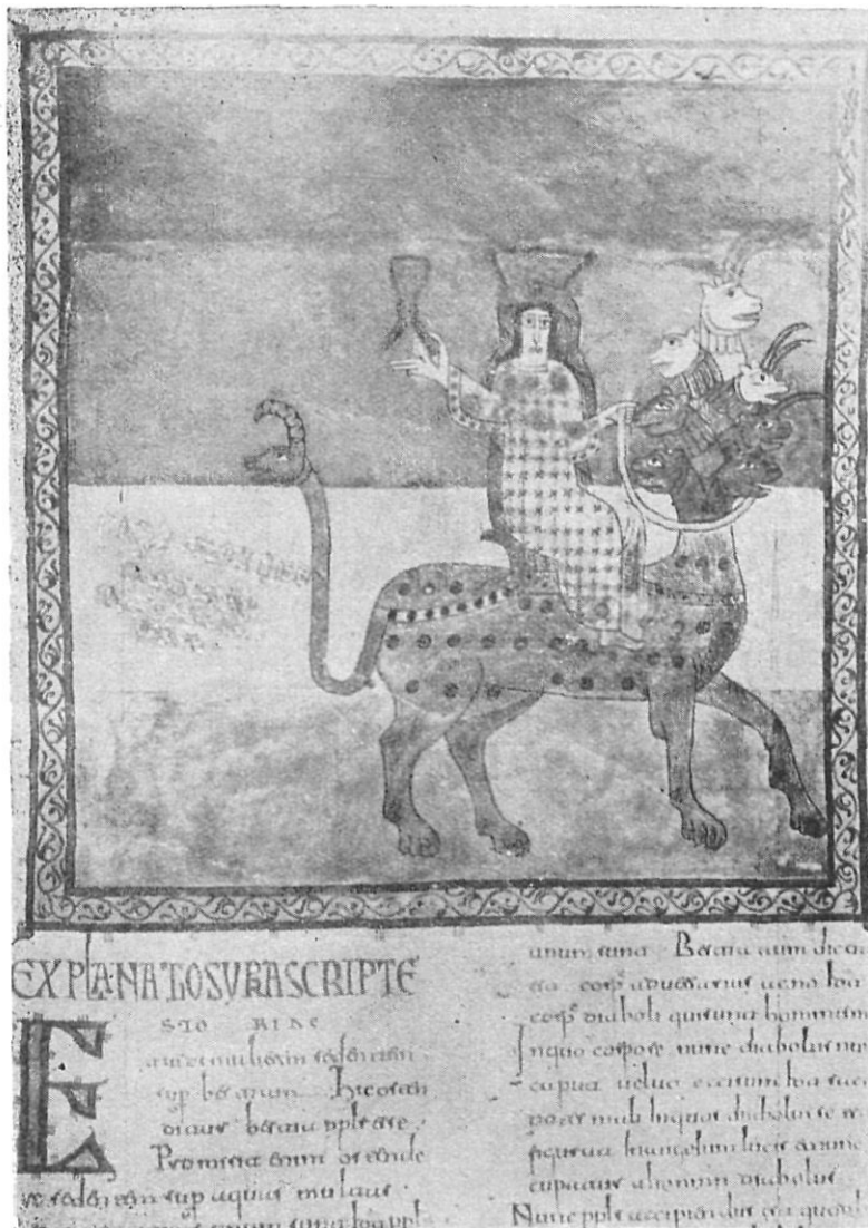
Núm. 5 — Escena de la mujer cabalgando sobre la bestia, según el Apocalipsis.

»Las siete cabezas son siete montes sobre los cuales se asienta la mujer y son siete reyes... Y los diez cuernos que viste son diez reyes, los cuales todavía no recibieron el reino, pero por una hora lo recibirán después de la bestia... Estos lucharán con el Cordero, pero el Cordero los vencerá... Las aguas que viste donde está sentada la ramera, son pueblos y naciones y lenguas... Y la mujer que viste es la ciudad grande que ejerce la realeza sobre los reyes de la tierra.»