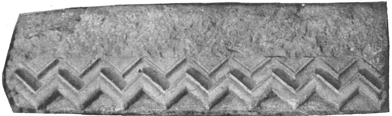
Núm. 2 — Relieve con motivos geométricos, procedente de la Seo Románica.

En este artículo, que constituye la primera revelación pública de los referidos hallazgos y de las consecuencias que de ellos se derivan, describiremos las piezas halladas, intentaremos reconstruir idealmente las estructuras a que pertenecían y aportaremos las conclusiones que a nuestro juicio, pueden derivarse del hallazgo en relación a la historia local.