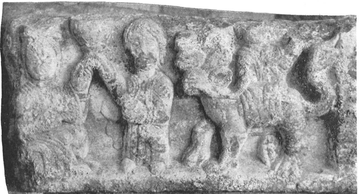
Núm. 3 — Relieve del Apocalipsis.

Hay una piedra que mide 30 \times 120 \times 20 cm. utilizada en la fábrica gótica como canal de desagüe, tiene una cara bien pulimentada, en parte de cuya superficie hay un adorno de tema vegetal, semejante al que decora el friso de las pilastras del claustro en el ala norte, que parece ser la más antigua de esta dependencia. El hecho de tener una parte de superficie lisa nos inclina a creer que se trata del dintel de una puerta o de la parte terminal de un friso que corriera a lo largo de un cornisamento decorativo de la iglesia románica. Un motivo semejante lo vemos corriendo a lo largo de la pared interior del frontispicio actual a manera de faja que señala el arranque de los arcos de las capillas y del portal de entrada. La diferencia está únicamente en el estilo, que es ba-