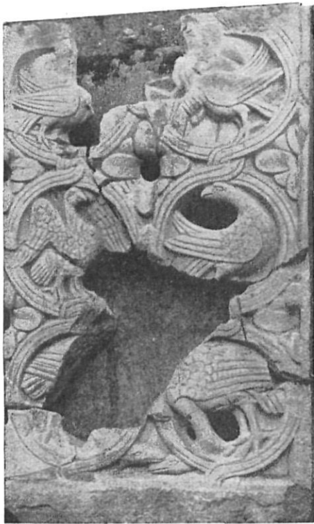
Núm. 6 — Resultado de la unión de los fragmentos del plafón de las águilas.

Aunque insuficientes para completar el dibujo, pero luminosos para conjeturar el resto, se han hallado tres fragmentos más