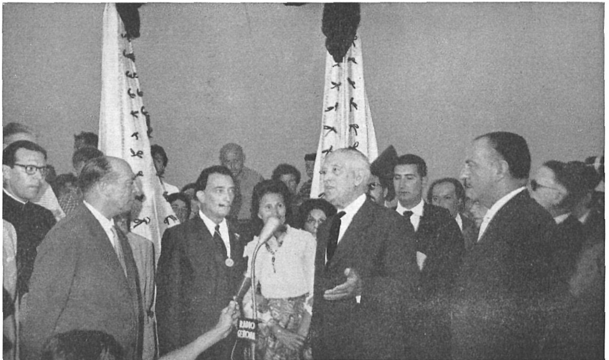
El señor Ministro don Pedro Gual Villalbí durante las palabras pronunciadas en el homenaje al artista de Port-Lligat.

Cerró el acto el Ministro sin cartera Sr. Gual Villalbí, con el siguiente discurso: «Los actos como éste tienen sus actores: los que los promueven y los que los motivan. El acto lo ha motivado el genio de Dalí y lo ha promovido la Diputación de Gerona, pero tienen un tercero, que es el público. Somos nosotros y hablo sin ninguna autoridad, hablo en nombre de todos vosotros, y el público a fin de cuentas en estos actos es el que juzga, el