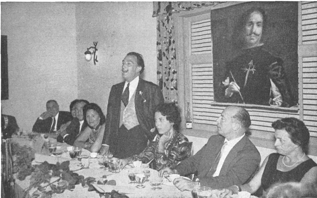
Palabras del homenajeado en la cena que le fue ofrecida por sus amigos.

Terminada la cena, el pintor se reunió con los representantes de la prensa con los que sostuvo un animado coloquio, dándoles una referencia del reciente incidente tenido con un periodista argentino, en la villa de Cadaqués, y a la vez exponiendo sus futuros proyectos, contestando a cuantas preguntas le fueron formuladas, y con esto finalizaron los actos que tuvieron lugar en Cadaqués, en el marco incomparable de Port-Lligat, que, envuelto en el sudario de una blanca niebla, dió a los mismos un sello más interesante.