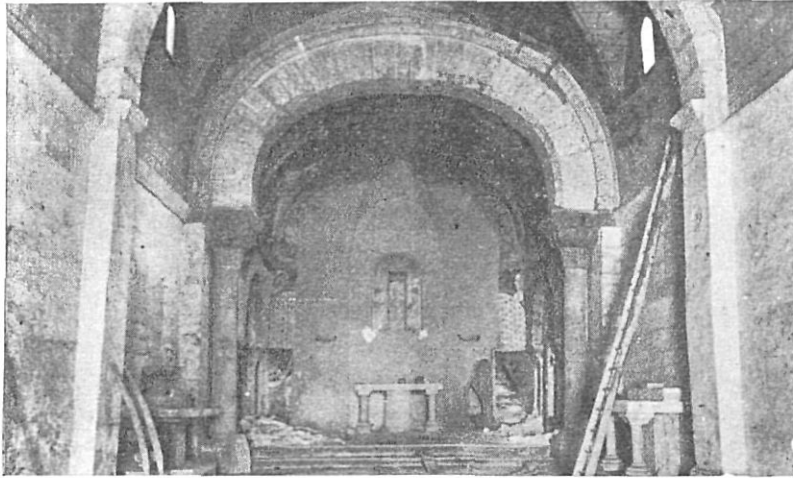
Aspecto del arco triunfal y la iglesia sin restaurar

Derribado el muro que separaba el ábside del presbiterio, apareció aquél tal como quedó después de las reformas practicadas en él a raíz de los terremotos del siglo XV. La consolidación de esta parte de la iglesia es la que más había preocupado a los párrocos a través de los siglos. El libro de la obra da cuenta repetidas veces de las múltiples reparaciones habidas en ella. Por fin el Servicio de Defensa del Patrimonio Artístico Nacional se arriesgó