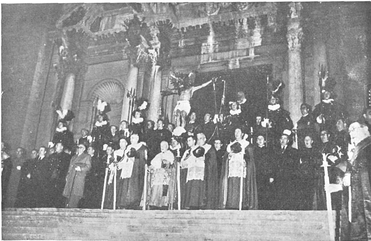
El Cristo de la Archicofradía de la Pasión y Muerte en el grandioso epítogo procesional en la Catedral