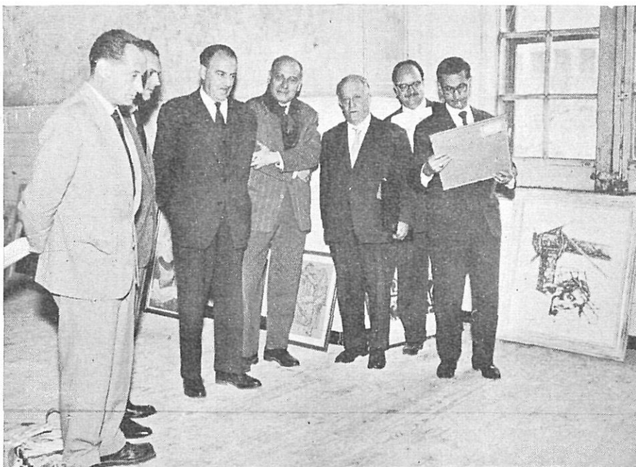
El Presidente de la Diputación, don Juan de Llobet, con los miembros del Jurado Calificador.

El conjunto de obras presentadas abarcaba este año todas las tendencias plásticas del momento actual, sin despreciar para nada la pintura realista y académica, como también la escultura