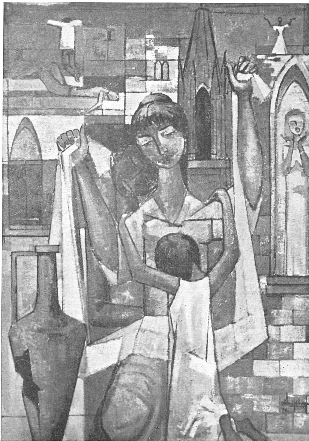
«GERONA INMORTAL 1809» de Eduardo Vila Fábrega, premio Los Sitios.