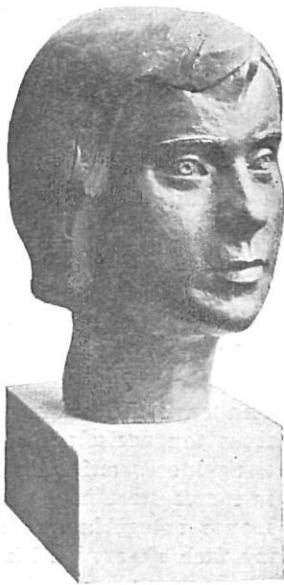
«RETRATO DE NIÑA» de Ramón Casellas Albert primera Medalla de Plata de escultura

Tres momentos del acto inaugural de la Exposición Provincial, a la que asistieron las primeras autoridades.