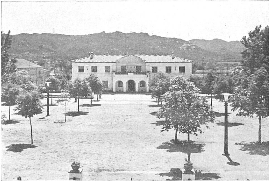
Urbanización de la Plaza Mayor presidida por el nuevo edificio municipal.

tendrán las que están en proyecto, a base de una robusta economía del vecindario. Si el industrial y el agricultor no hubieran tenido medios para el desarrollo de su erario particular, habrían fracasado todos los intentos. Se logró por medio del Reglamento de Pósitos del Ministerio de Agricultura. Se procuró y se pudo elevar el Pósito Agrícola Local a la máxima cantidad posible para poder hacer préstamos benéficos locales a los agricultores que los solicitaran. Hoy el Ayuntamiento dispone de un millón cuatrocientas mil pesetas