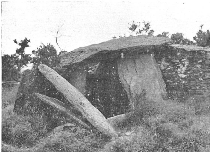
Dolmen de La Creu d'En Cobertella antes de la restauración

excavación necesarios para determinar en lo posible la forma y longitud del resto del corredor desaparecido de tiempo inmemorial. Finalmente había que procederse a la extracción y cribado del contenido de la cámara y limpiar y adecentar los alrededores. Todos estos trabajos se llevaron a cabo entre el 15 de julio y el 5 de agosto de 1957.