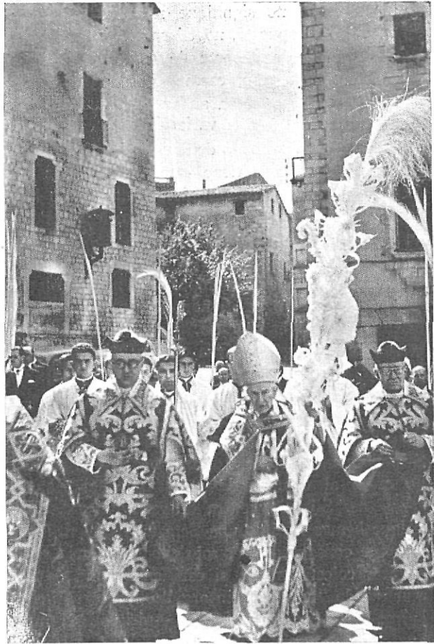
El obispo de la diócesis en la procesión del Domingo de Ramos.

Si servir a la tradición significase servilismo a la rutina conservadora poco motivo tendríamos para mostrar satisfacción. Tradición es estar en línea de estilo admitiendo con el alma muy abierta toda evolución que sirva al hombre. Cristo lo era tanto en un lienzo clásico como puede serlo en uno moderno, siempre que a la obra de