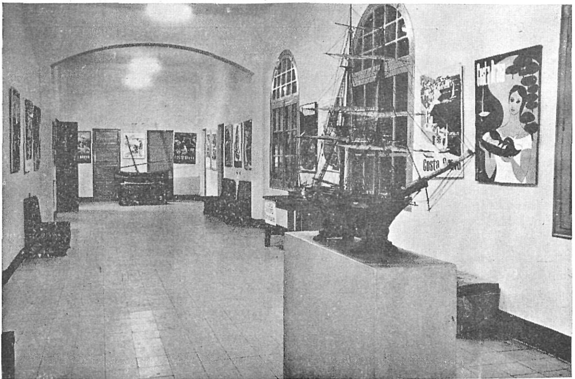
Esta fotografía recoge uno de los aspectos de la Exposición.

Aludió al desarrollo de este renombre mundial que ha alcanzado la Costa Brava, logrado gracias a la paz y al bienestar material que disfrutamos. En este aspecto advirtió que debíamos tener presente