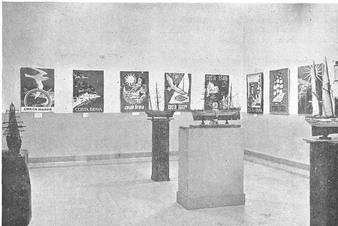
Los carteles premiados pueden apreciarse en este detalle de una de las salas de la Exposición.

todo cuanto concierne a esta paz y añadió que es de bien nacidos agradecerlo al hombre que rige los destinos de la Patria, al Caudillo Franco, al que hemos de rendir el fruto de estas conquistas y nuestro más ferviente homenaje.