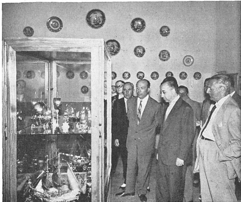
Inauguración de la sala dedicada a la aportación del Palacio de Peralada.

Dijo que estas visitas a la Costa Brava estaban muy lejos de realizarse con ánimo de hallar ambiente de frivolidad, ya que aquí vienen los que necesitan y desean descanso. Señaló, por lo tanto, que era obra social y se hacía patria por todo lo que se conseguía en beneficio de la Costa Brava.