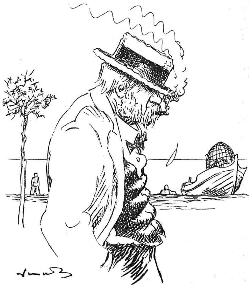
«l'Avi» de Junceda

Y lo extraño es que los gerundenses, y en especial los artistas, a pesar de lo que escribieron Ruyra