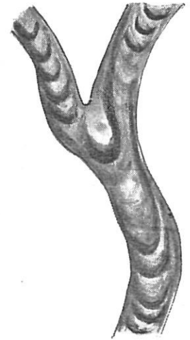
Fig. 3. Movimiento de ola en las hifas de Rhizopus nigricans (Según Arthur. De la Fisiología de Noll.)

Por lo que toca a los mecanicistas , que creen que todo depende de la organización, suponen que cuando la materia de tal manera se organiza que adquiere la disposición de un órgano, entonces funciona como tal. Parece increíble que lleguen a pensar que ésto sea de suyo posible. En todo caso llamado por el Instituto Médico-Valenciano a darles algunas conferencias, éstas se encaminaron a combatir ese mecanicismo que parece había contagiado a muchos médicos de aquel tiempo. Después de combatir tan extrañas ideas, dije públicamente que estaría aún algunos días en Valencia; y si alguno tuviese dificultades, con gusto procuraría resolvérselas. De hecho vino un joven médico que estaba tan imbuído en ese mecanicismo que nos dijo que en el hígado se habían descubierto un gran número de hormonas ; y se imaginaba que con ésto funcionaba mecánicamente el hígado . Viendo que estaba como aferrado a su mecanicismo , le dije: Pero ¿cómo se ha formado este hígado con tantas hormonas? Entonces cayó en la cuenta de su error y se confesó vencido. Si supiesen algo de Embriología esos mecanicistas , no dirían esos disparates, ni les pasaría por el pensamiento que fuese posible que la materia pudiese de suyo organizarse. Sin un principio organizador no hay organización. Este principio organizador es la Vida o mejor el principio vital sin el cual nada se explica.