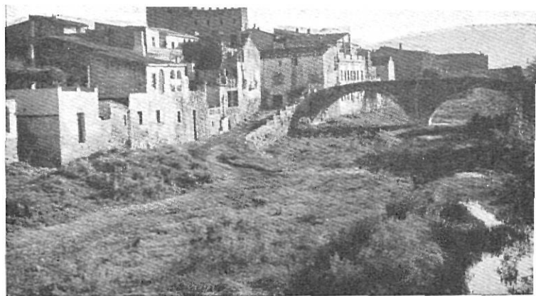
La Ciudad vieja en cuyo centro se levanta el vetusto Castillo que fué de los Obispos de Gerona, de los que procede el nombre de La Bisbal. En primer término el viejo puente románico sobre el Río Daró en el camino antiguo de Gerona.

En el Archivo Municipal (15) consta el siguiente registro: 4 Comercios de Ultramarinos, 9 de Comestibles, 17 de Abacería, 7 de Vinos, 15 de Cereales, 5 Carnicerías, 1 de Arroz, 5 de Ropas Hechas, 11 de Tejidos, 12 Mercerías, 1 de Gorras, 13 de Calzados, 4 Droguerías, 2 Perfumerías, 3 Ferreterías, 2 de Maquinaria Agrícola, 2 Armerías, 2 de Muebles, 8 de Loza, 1 de Curtidos, 2 de Radios, 1 de Velocípedos, 5 Librerías, 14 Car-